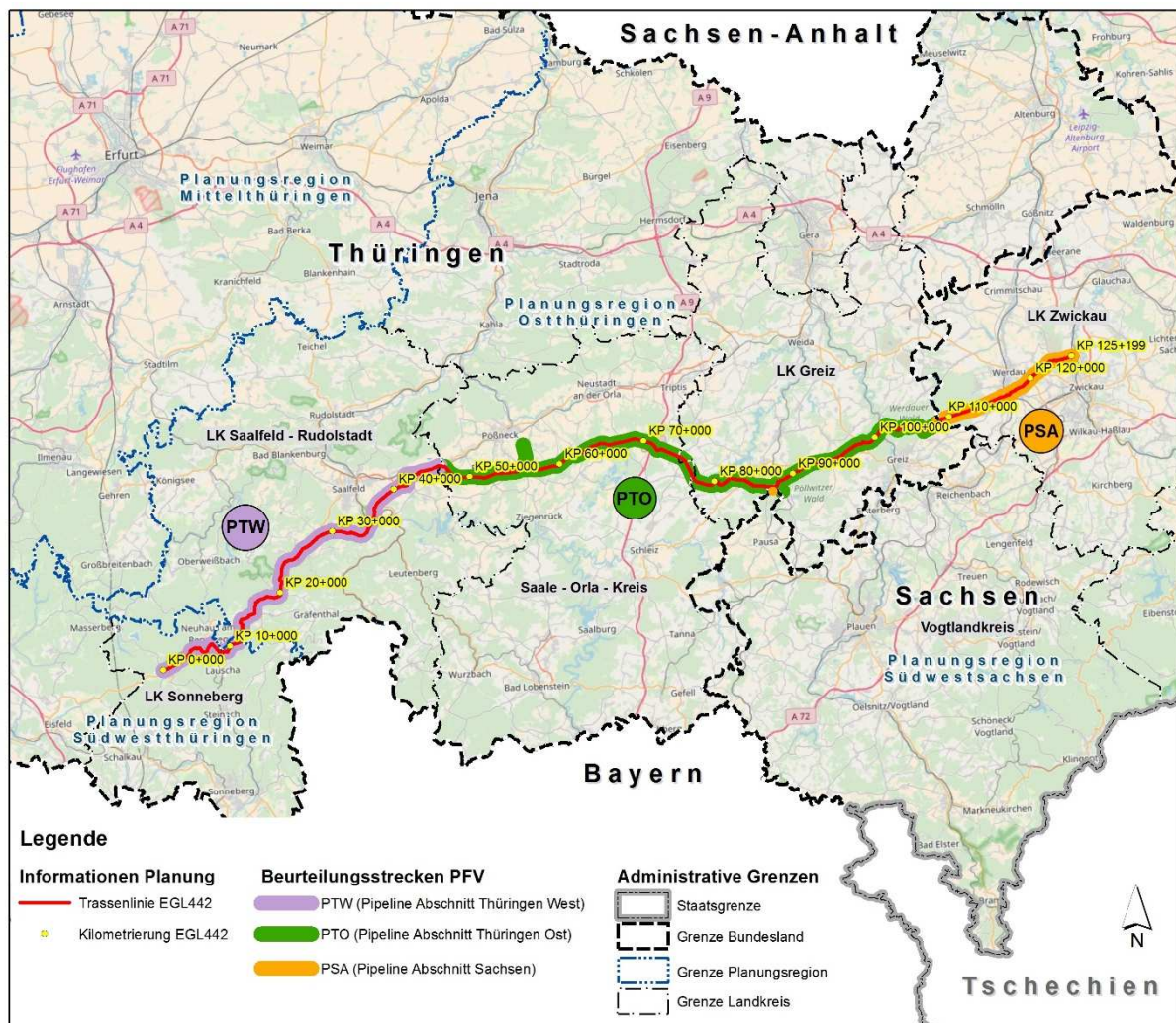
Abbildung 1: Untergliederung Planfeststellungsanträge 1