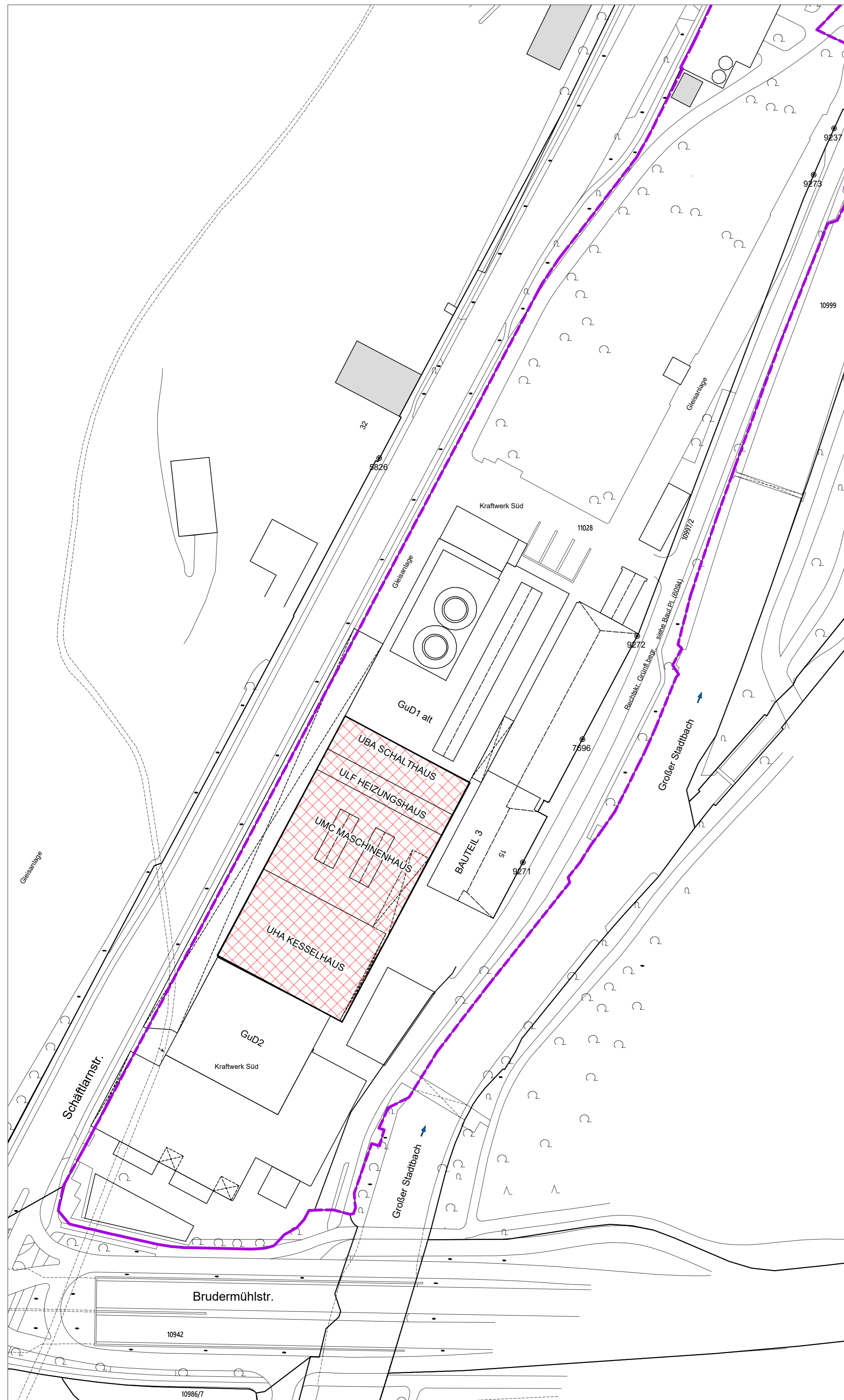
LAGEPLAN (vor Baubeginn) M 1:1000