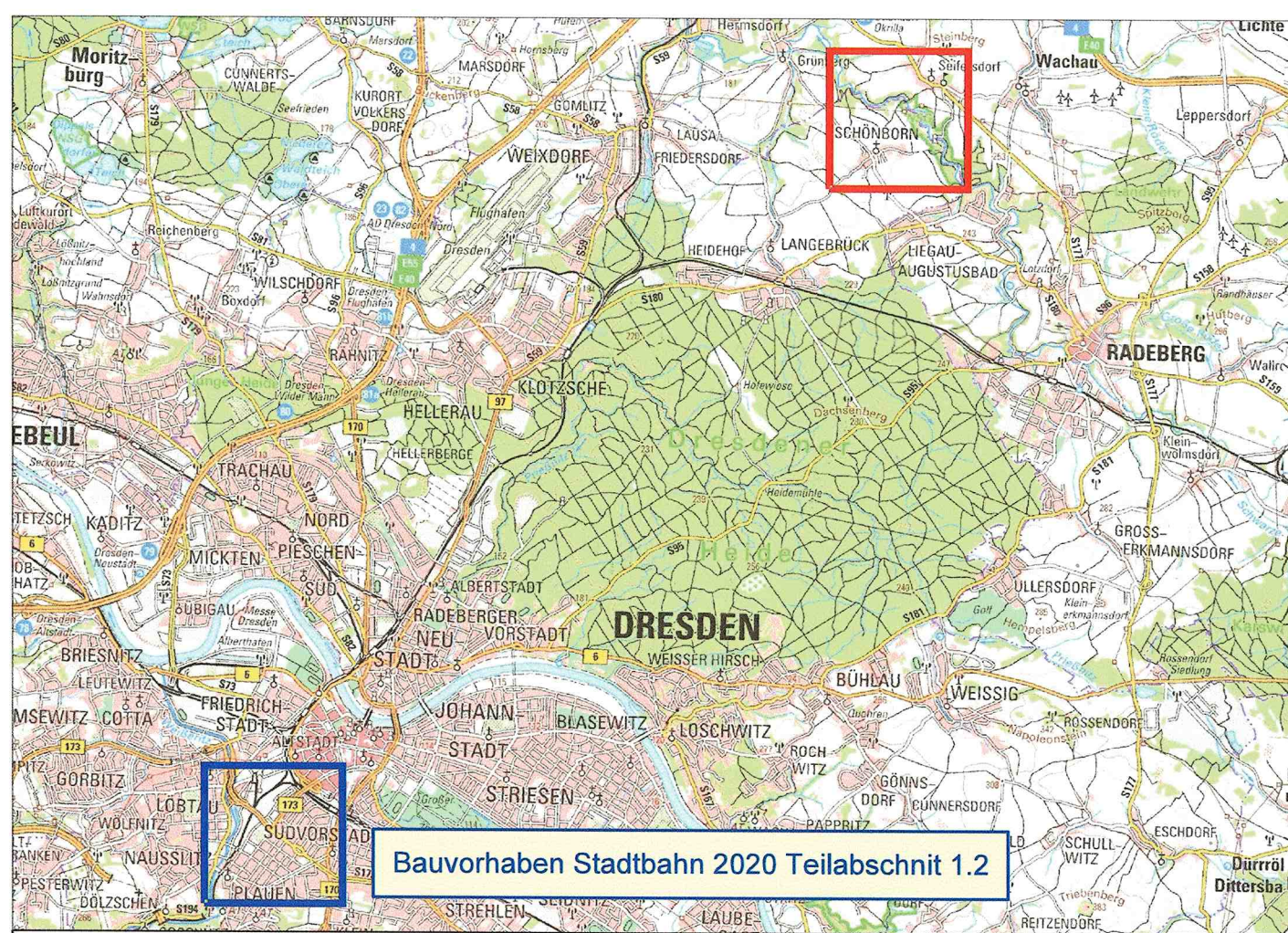
Übersichtslagepläne (Grundlage: TK 10 / TK50; ohne Maßstab)