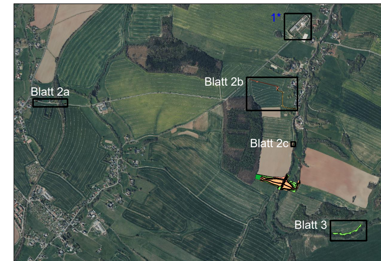
Übersichtsplan M 1:20000

1* Entsiegelungsmaßnahme nicht detaillierter dargestellt, da es sich um eine Ökokontomaßnahme handelt