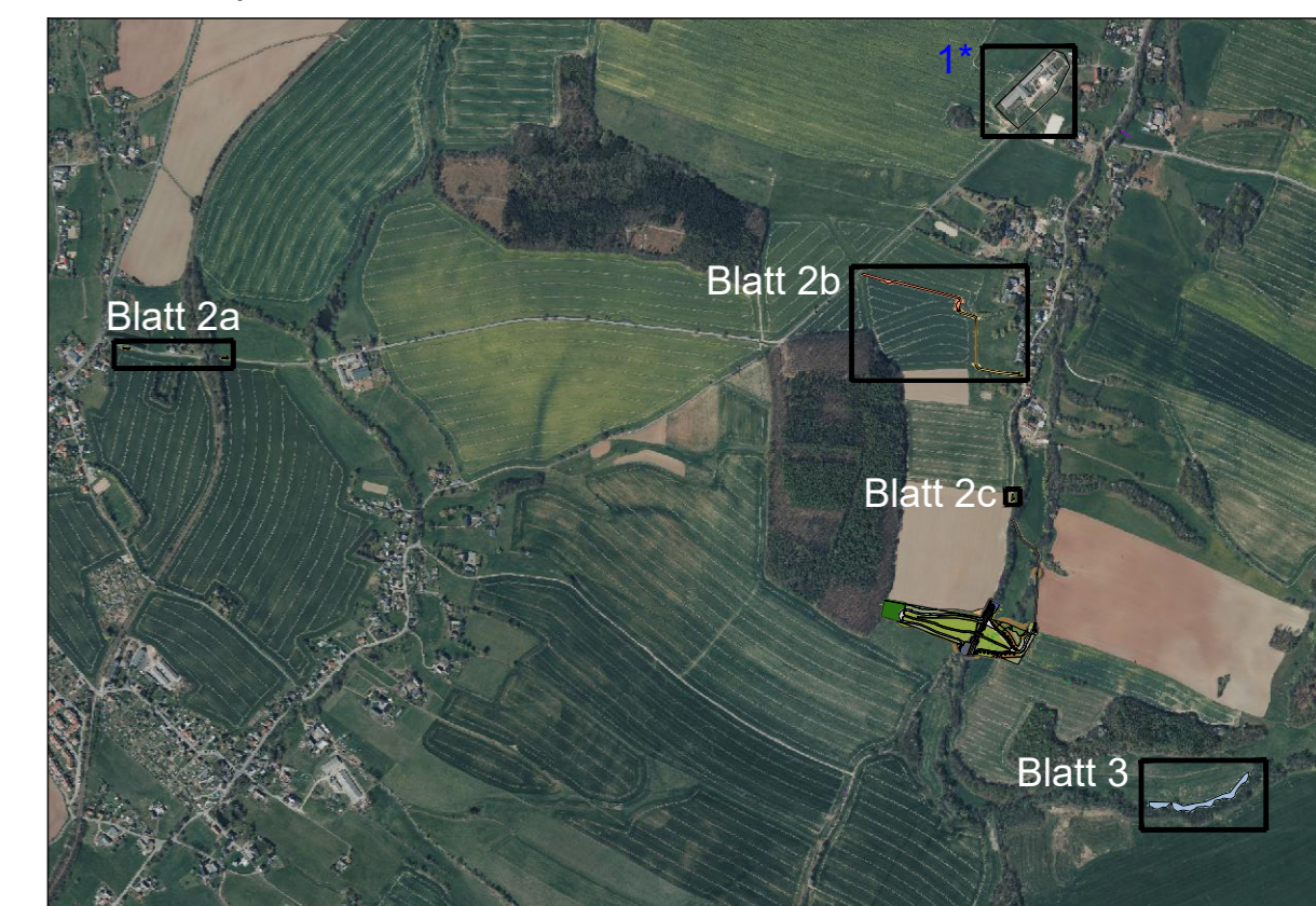
Übersichtsplan M 1:20000

1* Entsiegelungsmaßnahme nicht detaillierter dargestellt, da es sich um eine Ökokontomaßnahme handelt