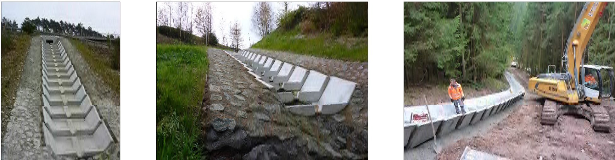
Ausführungsbeispiel Kaskade mit Verlegung in Beton