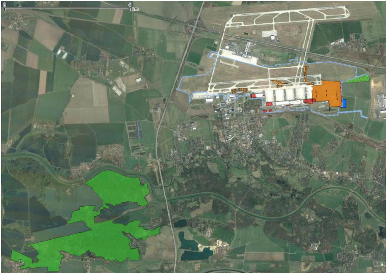
Abb. 2 Übersicht der geplanten flächenhaften Eingriffe im Süden des Flughafens. orange - geplante Flugbetriebsflächen i. w. S. (Vorfelderweiterung, Rollwege, Flugzeugenteisungspositionen, Schneedeponie, Flächen für Anlagen der Abwasserentsorgung, sonstige Ver-/Entsorgungsanlagen), hellorange - Geländeanpassungen, rot - geplante bauliche Anlagen Hochbau, blau - BE-Fläche, hellgrün - Erddeponie, hellblau - Regenklärbecken, pink - neue Zaunstraße, hellblaue Linie - Planfeststellungsgrenze Start- und Landebahn Süd mit Vorfeld. Grüne Flächen im Südwesten - nächst gelegene Teilflächen des SPA 4638-401 "Saale-Elster-Aue südlich Halle".

das Ziel bei KEP-Dienstleistungen eine Zustellung über Nacht ("Nachtsprung"); entsprechend handelt es sich i. d. R. um Nachtflüge. Von besonderer Bedeutung im KEP-Flugverkehr ist die Optimierung der Abstellungen ("engpassfrei"), weshalb insbesondere das Vorfeld 4 (DHL-Vorfeld) erweitert und zusätzliche Rollwege gebaut werden sollen.