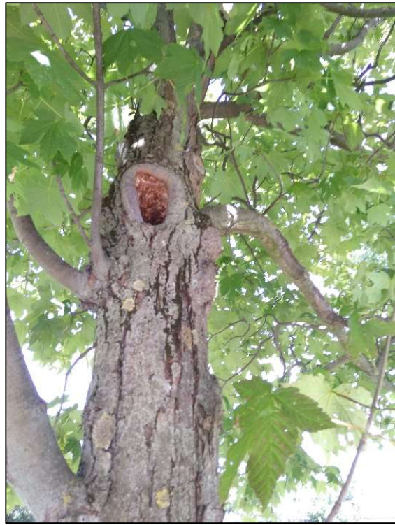
Abbildung 1: kleiner Baum ganz im Norden der zu fällenden Baumreihe (Blatt 7)