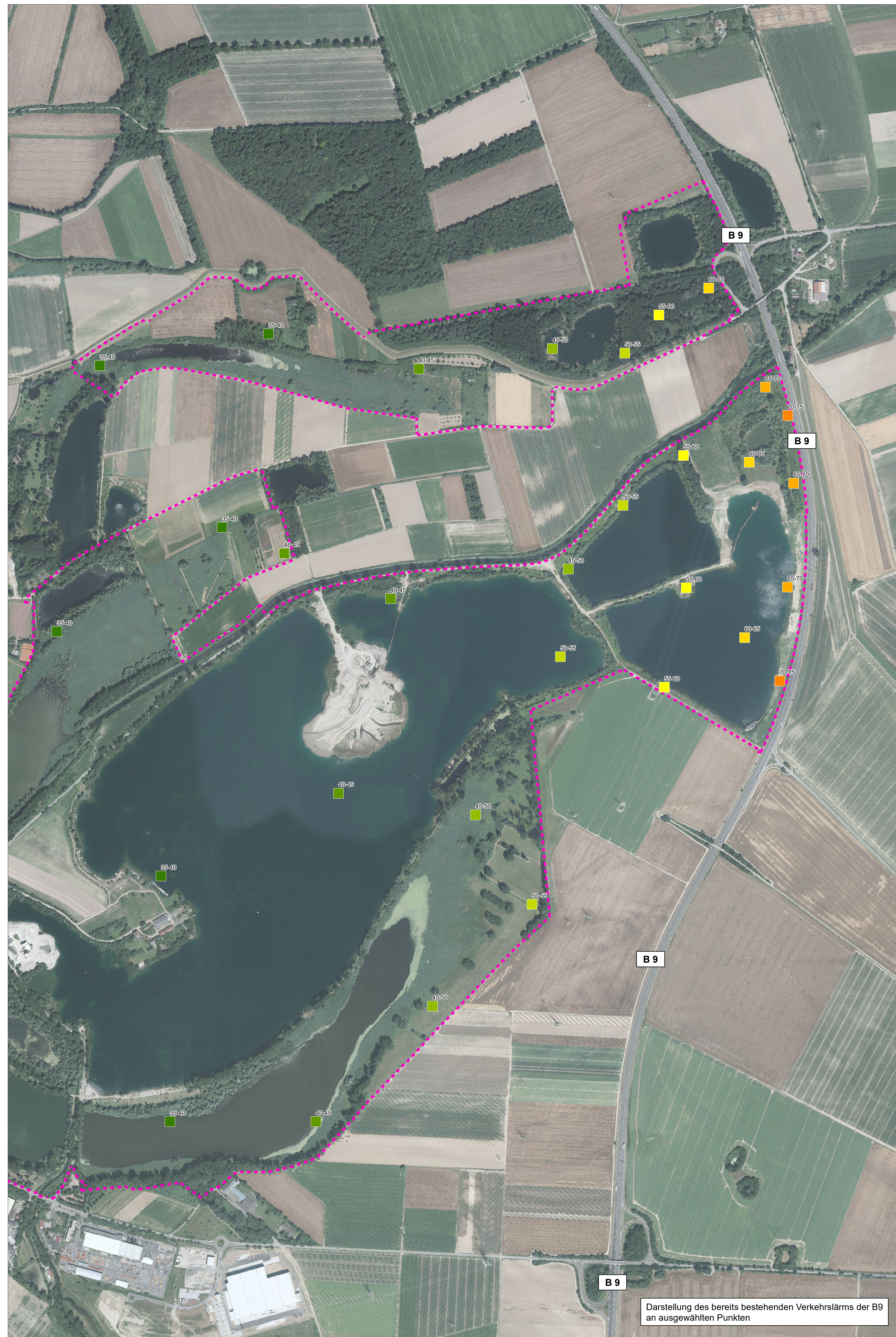
Darstellung des bereits bestehenden Verkehrslärms der B9 an ausgewählten Punkten