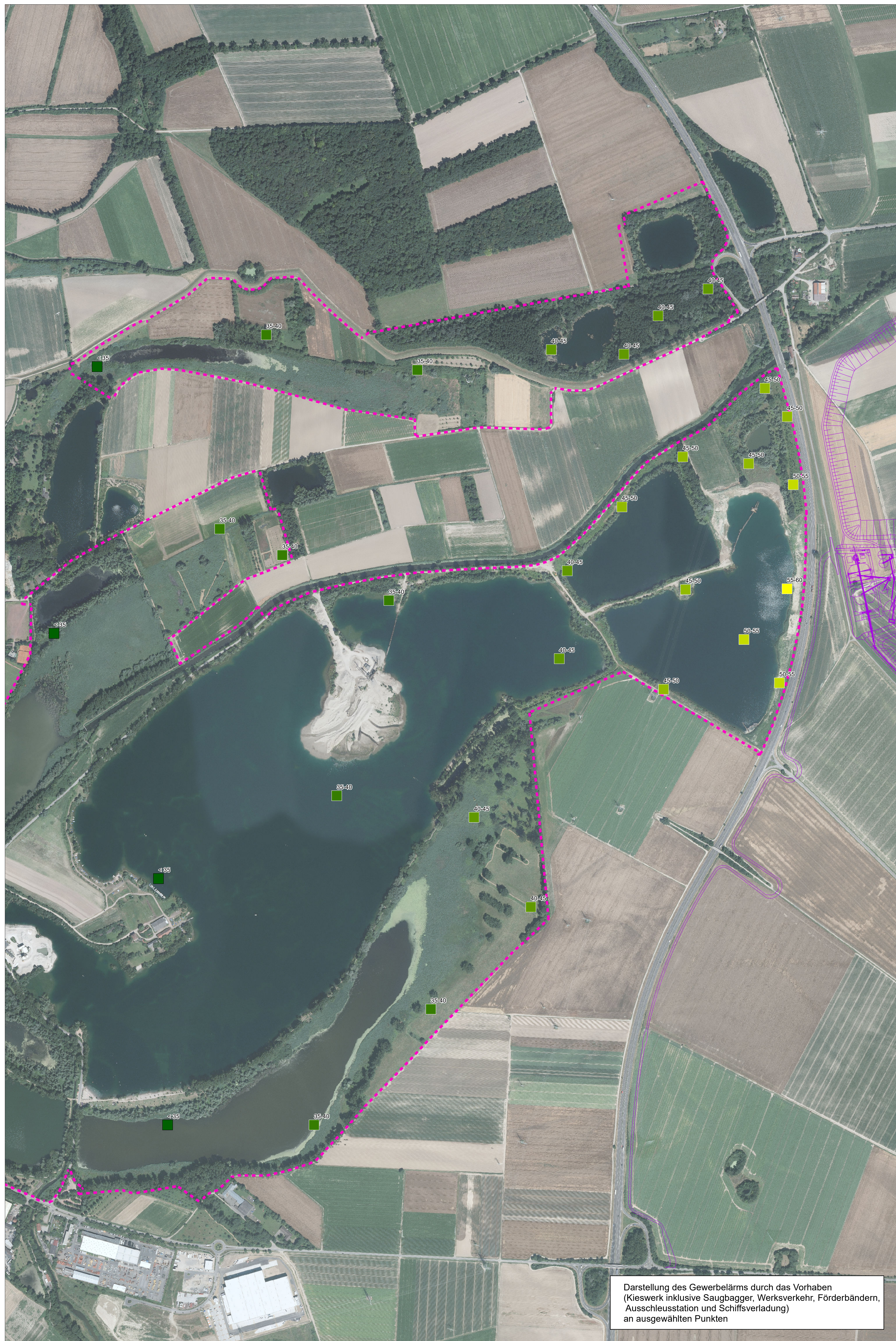
Darstellung des Gewerbelärms durch das Vorhaben (Kieswerk inklusive Saugbagger, Werksverkehr, Förderbändern, Ausschleusstation und Schiffsverladung) an ausgewählten Punkten