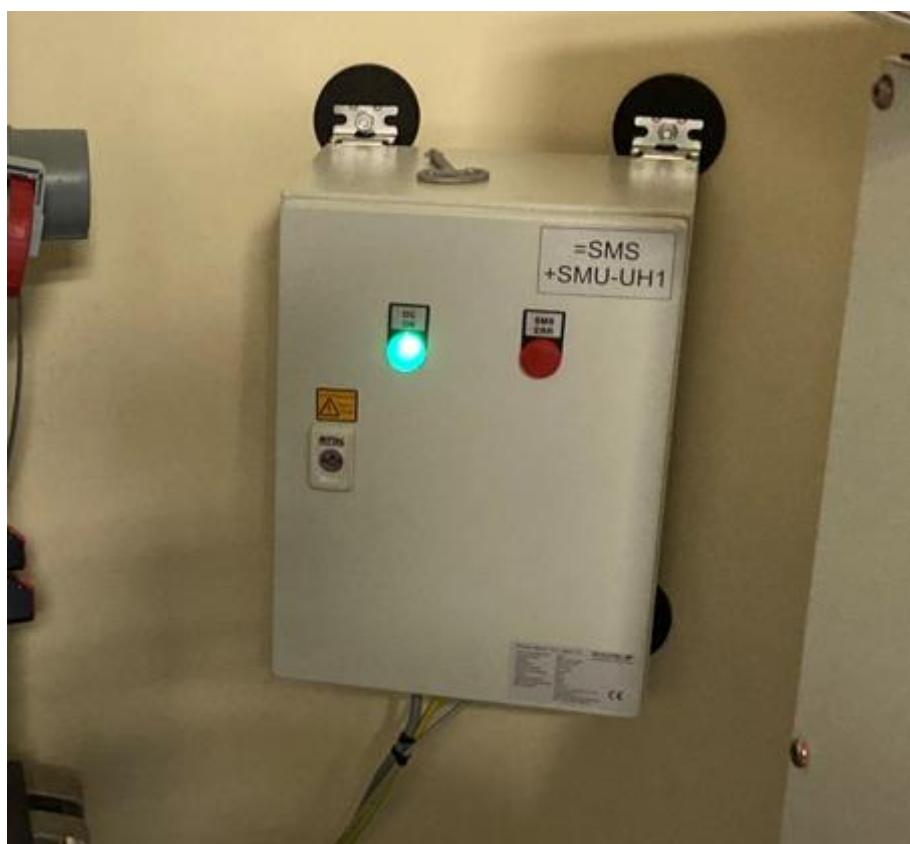
Abbildung 11-1: SMU4 Modul des Schattenwurfschutzsystem

Die SMU des Schattenwurfschutzsystem, welches in einem Schaltschrank mit der Schutzklasse IP 65 eingebaut ist, wird im Turmfuß der WEA angebracht.-Das Modul wird in der Regel in der Master-WEA am Standort untergebracht.