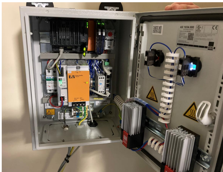
Abbildung 11-2: Innenansicht SMU Modul des Schattenwurfschutzsystem