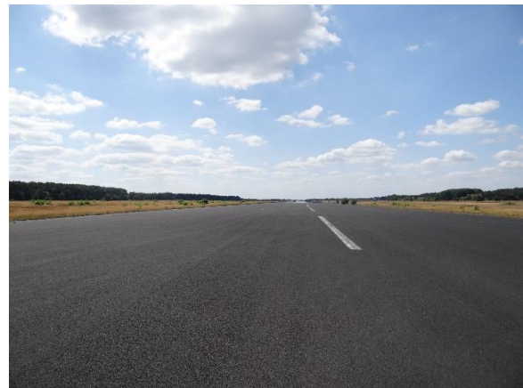
Abbildung 6.13: Blick von FP3 in Richtung W