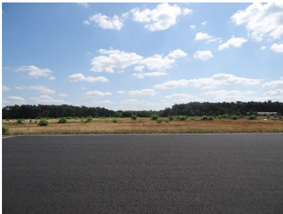
Abbildung 6.12: Blick von FP3 in Richtung S