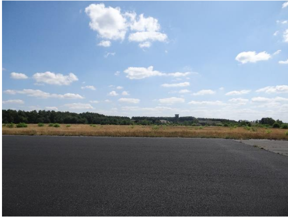
Abbildung 6.4: Blick von FP1 in Richtung S