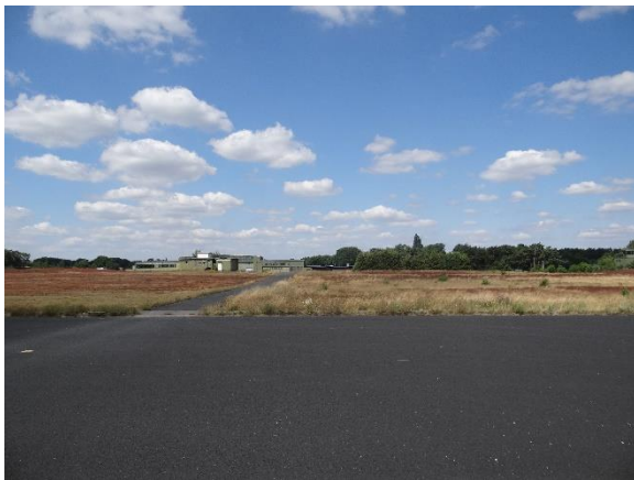
Abbildung 6.6: Blick von FP2 in Richtung N