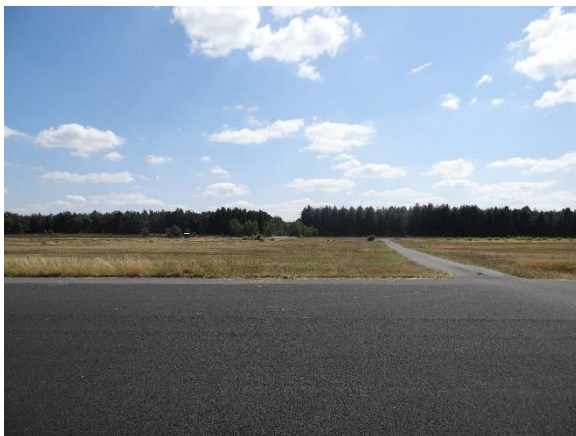
Abbildung 6.8: Blick von FP2 in Richtung S