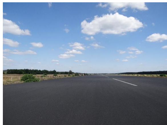
Abbildung 6.3: Blick von FP1 in Richtung O