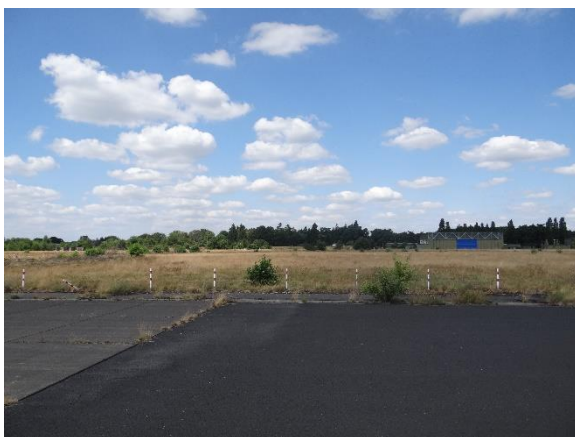
Abbildung 6.2: Blick von FP1 in Richtung N