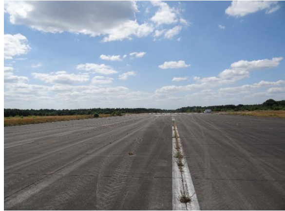
Abbildung 6.5: Blick von FP1 in Richtung W