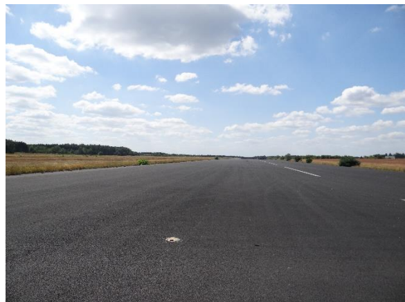
Abbildung 6.9: Blick von FP2 in Richtung W