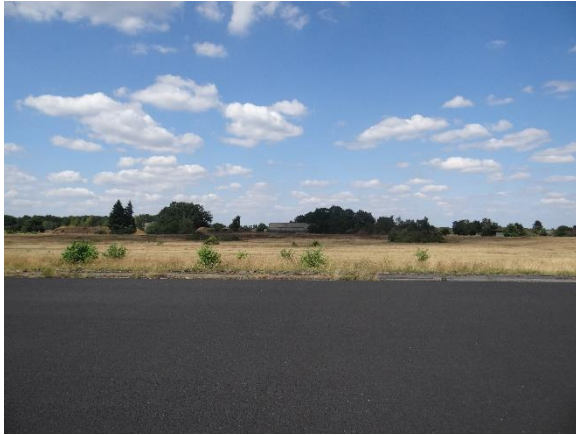
Abbildung 6.10: Blick von FP3 in Richtung N