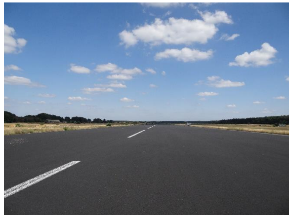
Abbildung 6.7: Blick von FP2 in Richtung O