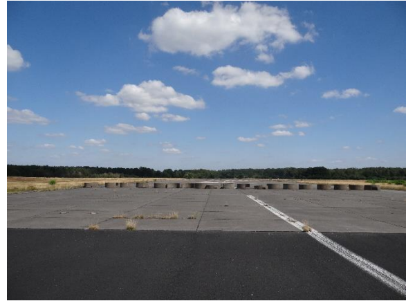
Abbildung 6.11: Blick von FP3 in Richtung O