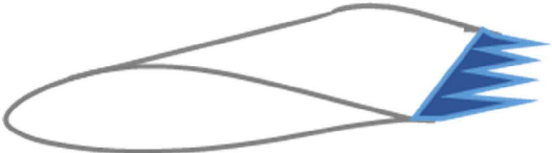
Abb. 2 Prinzipskizze Serrations

Serrations ersetzen den gradlinigen Verlauf der Hinterkante des Rotorblatts durch eine gezackte Linie (siehe Abb.2). Dieser Verlauf führt dazu, dass der Übergang auf die freie Außenströmung der in der Grenzschicht vorhandenen Wirbel an der Hinterkante nicht mehr schlagartig sondern graduell, entlang der von den Serration-Zacken geformten neuen schrägen Hinterkante, erfolgt. Somit wird das Entstehungsprinzip des turbulenten Hinterkantenschalls beeinflusst und eine Lärminderung erzielt.