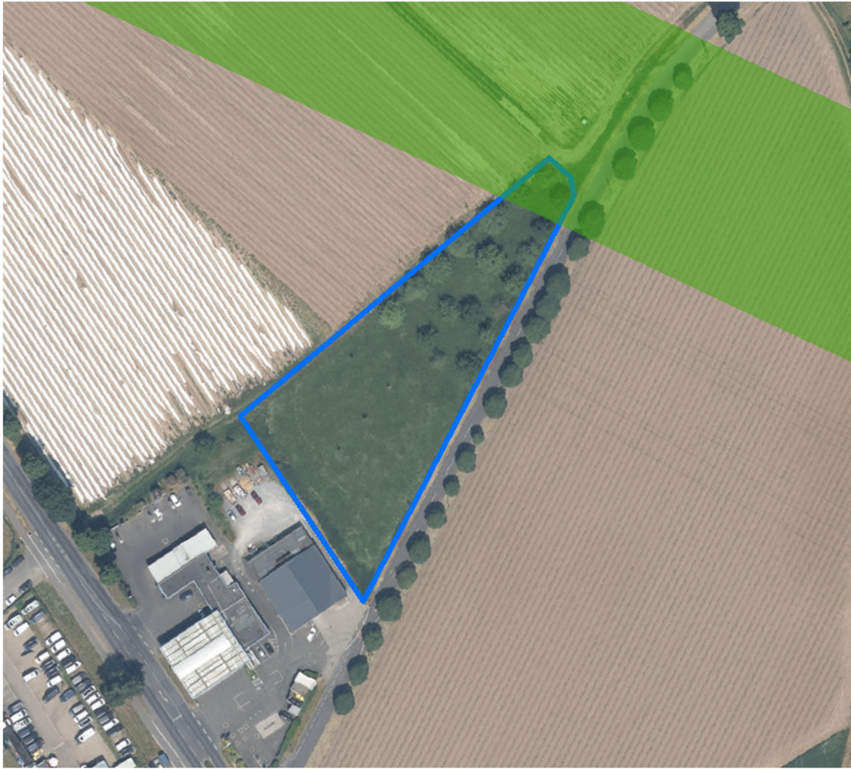
Abb. 3 Luftbild der Kompensationsfläche an der B9 in Dormagen

(Abb. genordet; Grün: Flächeninanspruchnahme der RWTL)