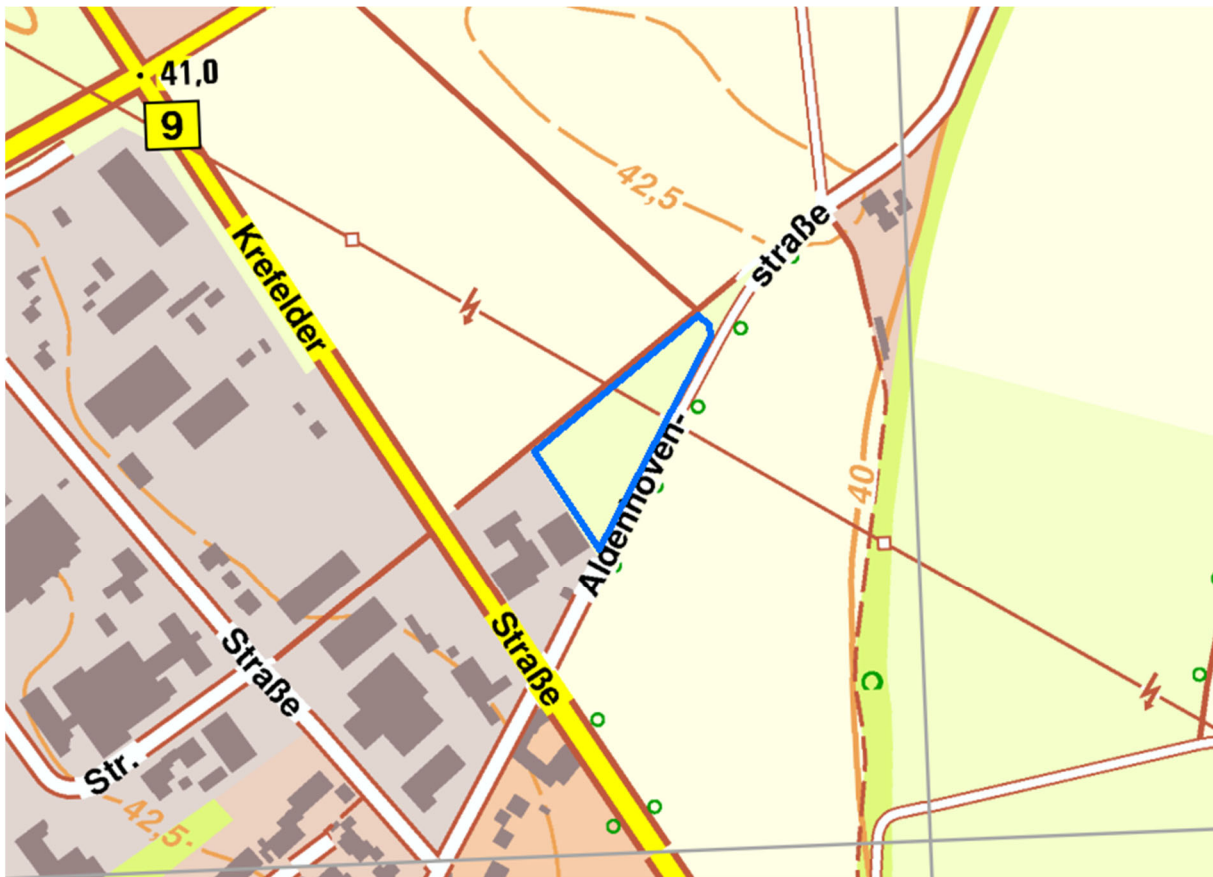
Abb. 2 Lage der Kompensationsfläche an der B9 in Dormagen (Abb. genordet)

Konkret betroffen durch das Vorhaben ist eine Fläche auf dem Stadtgebiet von Dormagen östlich der B9, nördlich der Aldenhovenstraße der B9. Es handelt sich um einen dreieckigen Flächenzuschnitt, der mit mittelalten Obstbäumen bepflanzt ist. Die Fläche ist als Streuobstwiese mittleren alters klassifiziert (Biotopcode: HK3, ta15a). Die beiden nachstehenden Abb. 2 und Abb. 3 zeigen die Lage der Fläche. In Abb. 3 ist zusätzlich die Flächeninanspruchnahme durch die RWTL dargestellt.