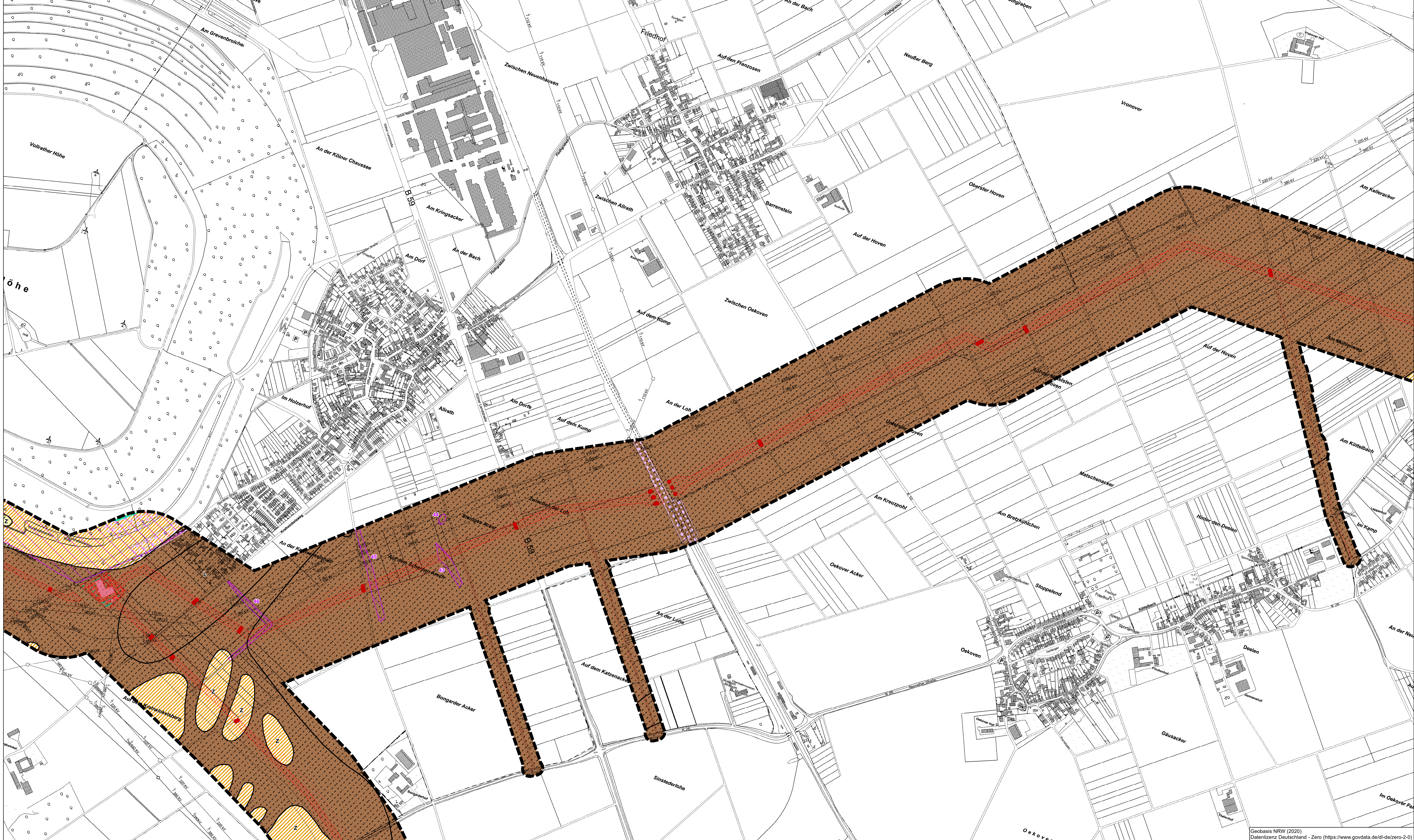
Karte 4: Schutzgüter Boden, Fläche, Klima und Luft