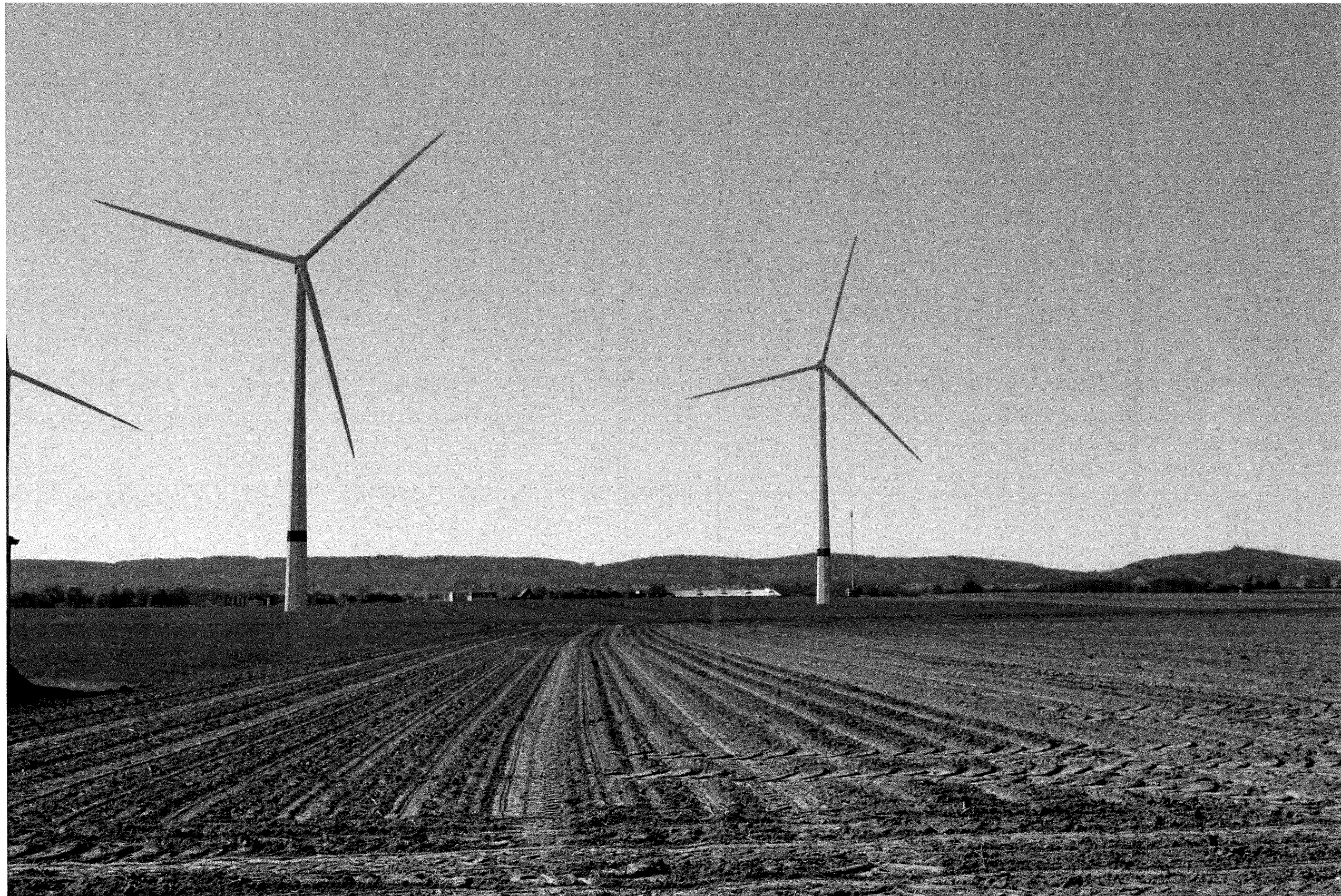
Abbildung 40 Visualisierung der geplanten WEA, im speziellen der WEA2 (Mitte), südlich vor dem Grundstück des WG 1