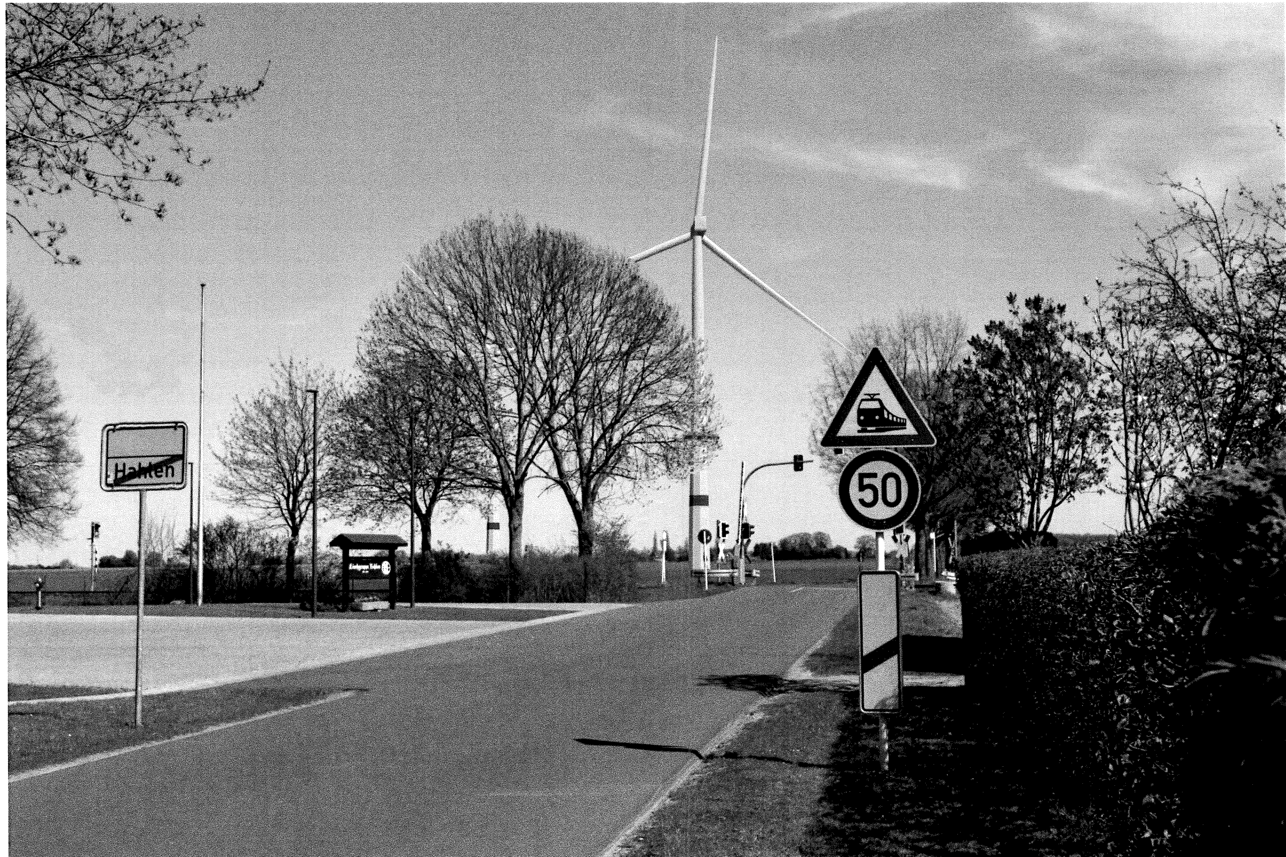
Abbildung 43 Visualisierung der geplanten WEA, im speziellen der WEA3 (Mitte), südwestlich an der Straße des Grundstückes des WG 4 (Fotopunkt 3.2)