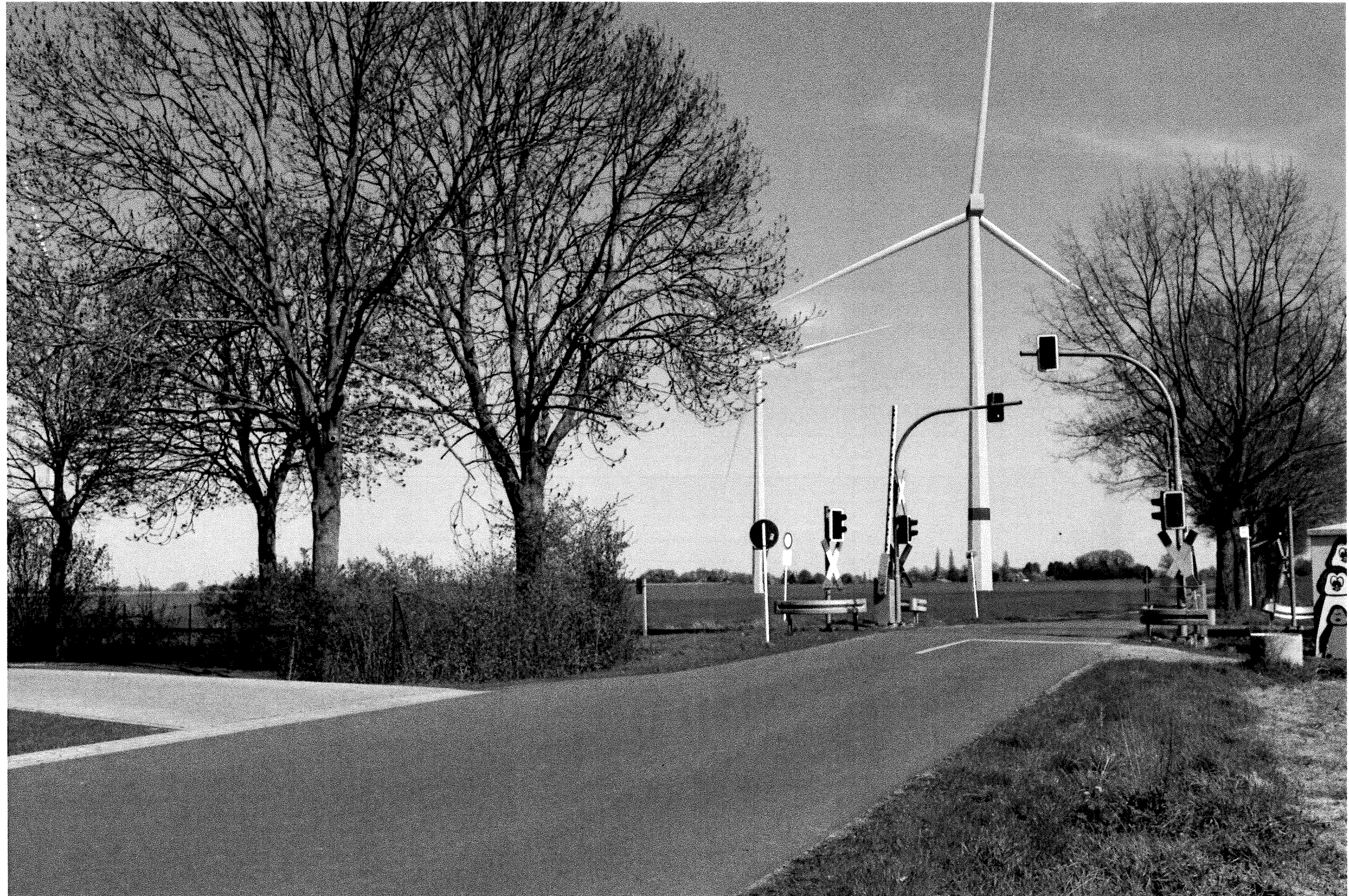
Abbildung 42 Visualisierung der geplanten WEA, im speziellen der WEA3 (Mitte), westlich an der Straße des Grundstückes des WG 3 Blickrichtung Norden