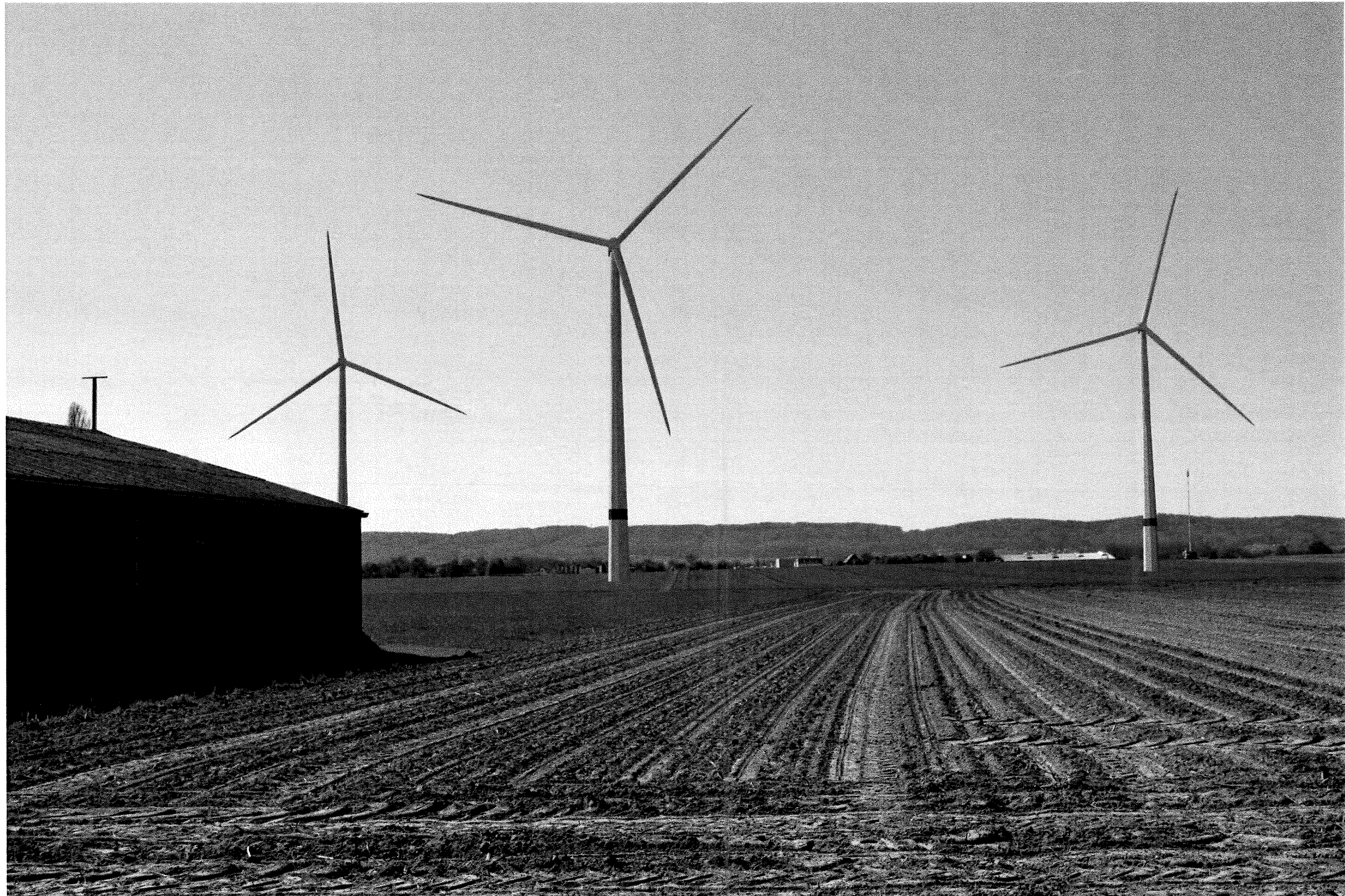
Abbildung 39 Panorama-Visualisierung der geplanten WEA, im speziellen der WEA2 (Mitte), südlich vor dem Grundstück des WG 1