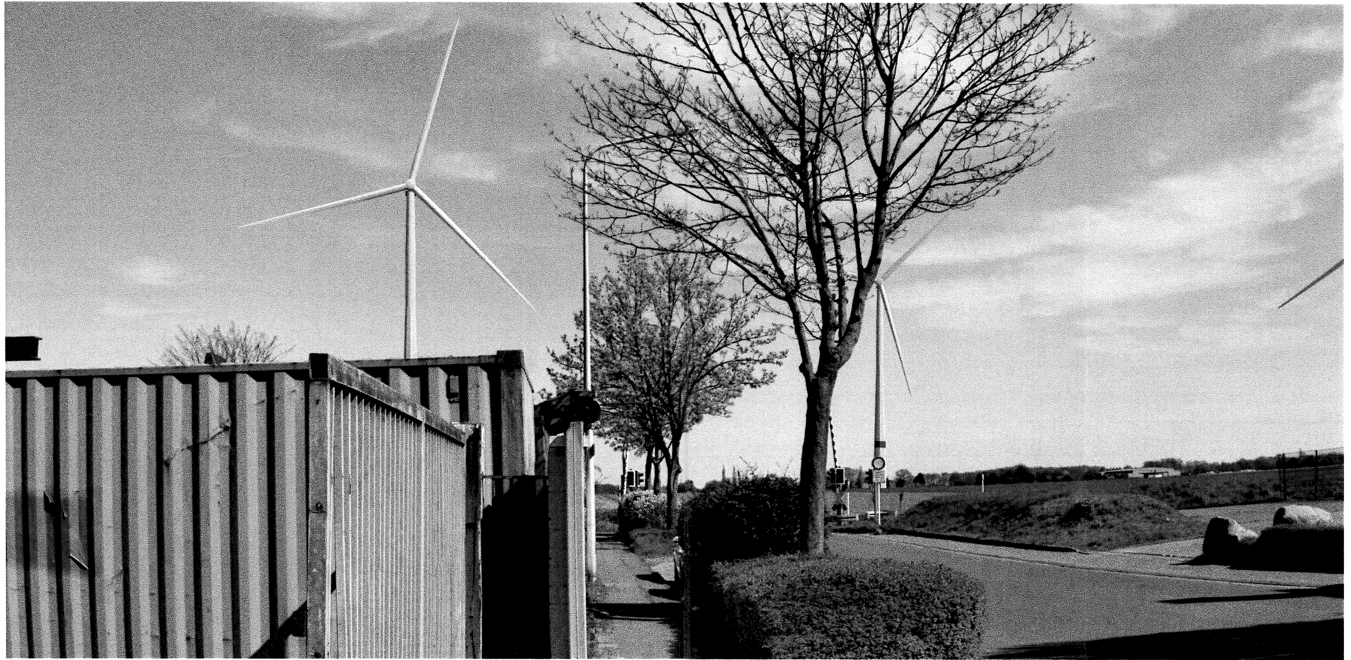
Abbildung 45 Visualisierung der geplanten WEA, im speziellen der WEA 1 (links), vor dem Grundstück des WG 6.