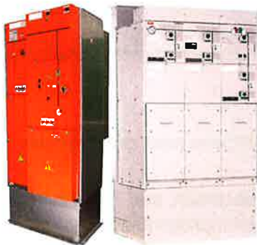
Abb. 3: Beispiel für 2- und 3-feldige MS-Schaltanlage

Bei einem Fehler im Kabelanschlussraum wird der entstehende Druck ebenfalls über den Sockel in den Druckentlastungskanal geleitet.