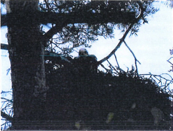
Abbildung 2: Mäusebussardhorst (Nr. 30) mit einem Jungen [REDACTED]

ausgeschlossen werden. Beim Horst [REDACTED] wurde Kotspuren gefunden, allerdings kein brütender Vogel oder Jungtiere. 2017 brütete hier der Kolkrabe. Für den Horst [REDACTED] kann die Brut eines Mäusebussards nicht vollständig ausgeschlossen werden. Es wurde frisch verbautes Laub festgestellt und ein Mäusebussard flog in der Nähe ab. Darüber hinaus erfolgte eine Nutzung dieses Horstes in den Jahren 2017 und 2018 durch den Mäusebussard. Jedoch konnte weder ein brütender Altvogel noch Jungtiere auf dem Horst gesehen werden.