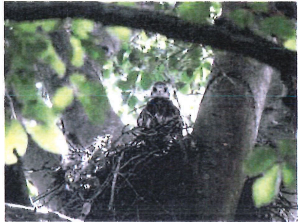
Abbildung 3: Mäusebussardhorst (Nr. 36) mit einem Jungen [REDACTED]