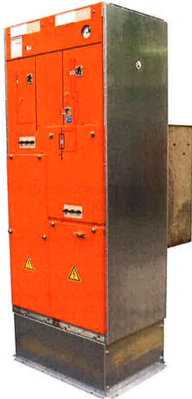
Abb. 3: Beispiel einer 2-feldigen Schaltanlage