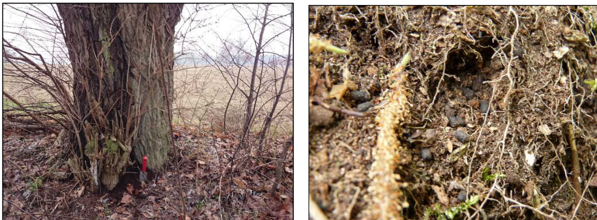
Abbildung 2: Lebensspuren von Rosenkäfern – Mulm/Kotpillen an Kopfweidenreihe (Baum Nr. 36)

Die potentiell geeigneten Bäume sind entlang der Wege im Untersuchungsgebiet konzentriert. Es handelt sich in erster Linie um Linden, die dort als Straßenbäume wachsen. An der L25 zwischen Mirowdorf und Starsow haben die Linden vor allem Astabbrüche die sich am Anfang der Höhlenbildung befinden während an der K3 nordwestlich Mirowdorf einige Bäume bereits größeren Höhlungen aufweisen. Das Vorhandensein der Höhlen wurde tlw. mit der Einschätzung einer potentiellen Besiedelbarkeit ausgedrückt, da keine Anzeichen einer tatsächlichen Besiedlung gefunden wurden. Die Einschätzung geht tlw. auch darauf zurück, dass die Höhlen aufgrund ihrer Höhe einer direkten Kontrolle nicht zugänglich waren.