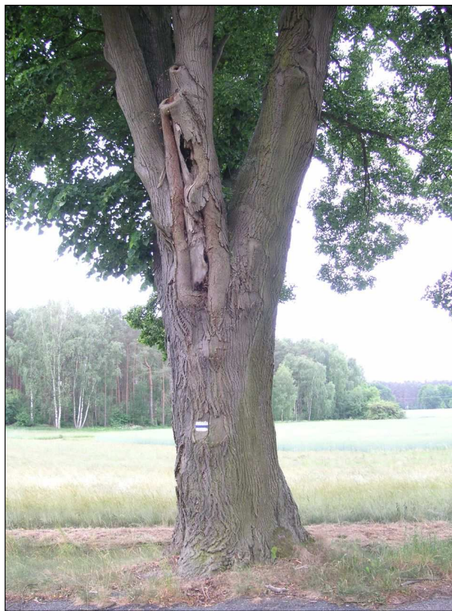
Abbildung 1: Linde mit Höhlenbildung und Mulmaustritt (Höhlenbaum 26, 2012)

In der Regel werden Straßenbäume jedoch entfernt, sobald Schäden am Stamm offensichtlich werden. Im Anfangsstadium sind diese kleinen Asthöhlen jedoch für anspruchsvolle Arten wie den Eremiten nicht geeignet, da sie zu wenig Mulm enthalten, zu hohe Temperaturschwankungen aufweisen und teilweise mit Wasser volllaufen, so dass die Larven ertrinken würden. So sehen die Stümpfe größerer Äste von unten sehr oft besser aus (im Sinne der Habitateignung für die betrachtete Art), als sie sich bei der direkten Kontrolle darstellen.