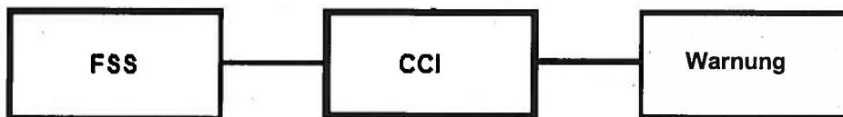
Abbildung1: Schaltplan der FSS-Überwachung

Um die Überwachung des Drucks in den Löschmittelzylindern des FSS zu ermöglichen, ist jeder Zylinder mit einem Druckschalter ausgestattet. Falls der Druck in einem Zylinder unter den zulässigen Schwellenwert sinkt, sendet das Steuerungssystem ein Warnsignal, das über SCADA weitergegeben wird.