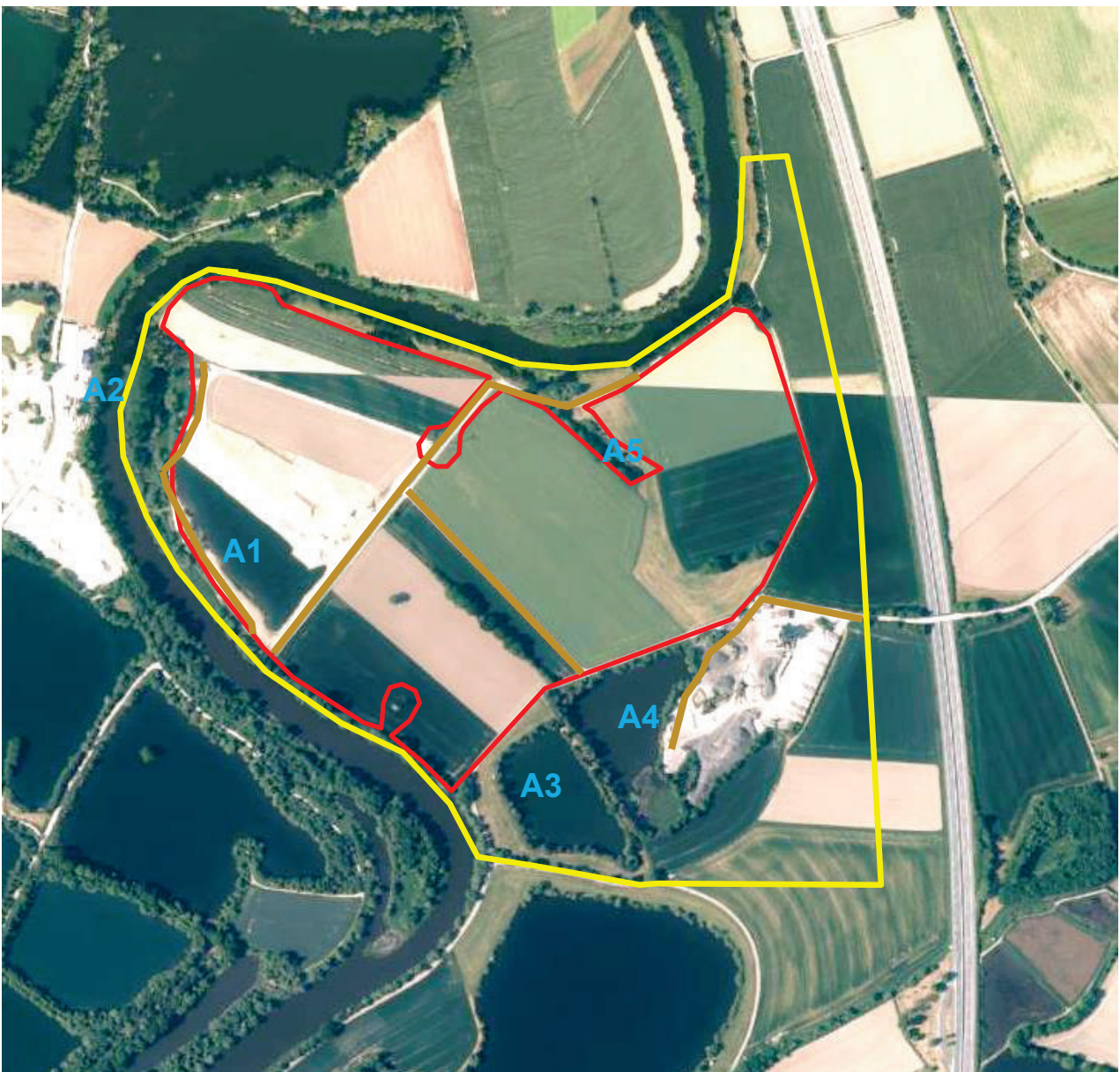
Abbildung 1: Artenschutzrechtlicher Untersuchungsraum des geplanten Kiesabbaus in der Naabschleife: Gelbe Linie = Untersuchungsraum Erweiterung für die Artengruppen Fledermäuse, Vögel, Reptilien und Amphibien (ca. 60 Hektar); rote Linie = beantragter Kiesabbau; braune Linie = Reptilientransekte, A1 bis A4 = auf Amphibien untersuchte Gewässer(abschnitte); (Grundlage: Bayerische Vermessungsverwaltung; online-Kartendienst Bayernatlas, ohne Maßstab, nicht zur Entnahme von Maßen geeignet)

Neben den Biotop- und Nutzungstypen, die innerhalb der Abbaufächen liegen (siehe Kapitel 2.2), befinden sich im Untersuchungsraum damit auch Auwaldstreifen mit Staudensäumen an der Naab, Ufersäume sowie landwirtschaftlichen Nutzflächen, bestehende Kiesgruben mit ihrem Randzonen, aufgelassene Kiesweihier sowie Baumhecken innerhalb der landwirtschaftlichen Nutzflächen. An der Naab findet vor allem Angelnutzung statt. Dort werden auch Angelplätze vom Bewuchs freigehalten, zudem sind kleine Einrichtungen /Bänke, Tische) angelegt worden.