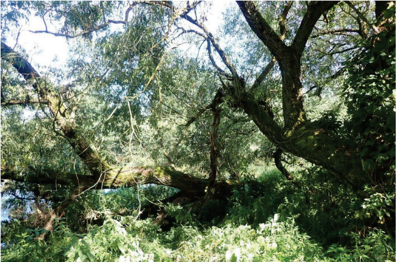
Abbildung 2: Ausschnitt aus dem Auwald an der Naab mit teilweise geschädigten Silberweiden, die potenzielle Verstecke für Fledermäuse hinter Rinde oder in Baumspalten aufweisen (Foto: Moos, Juni 2022).