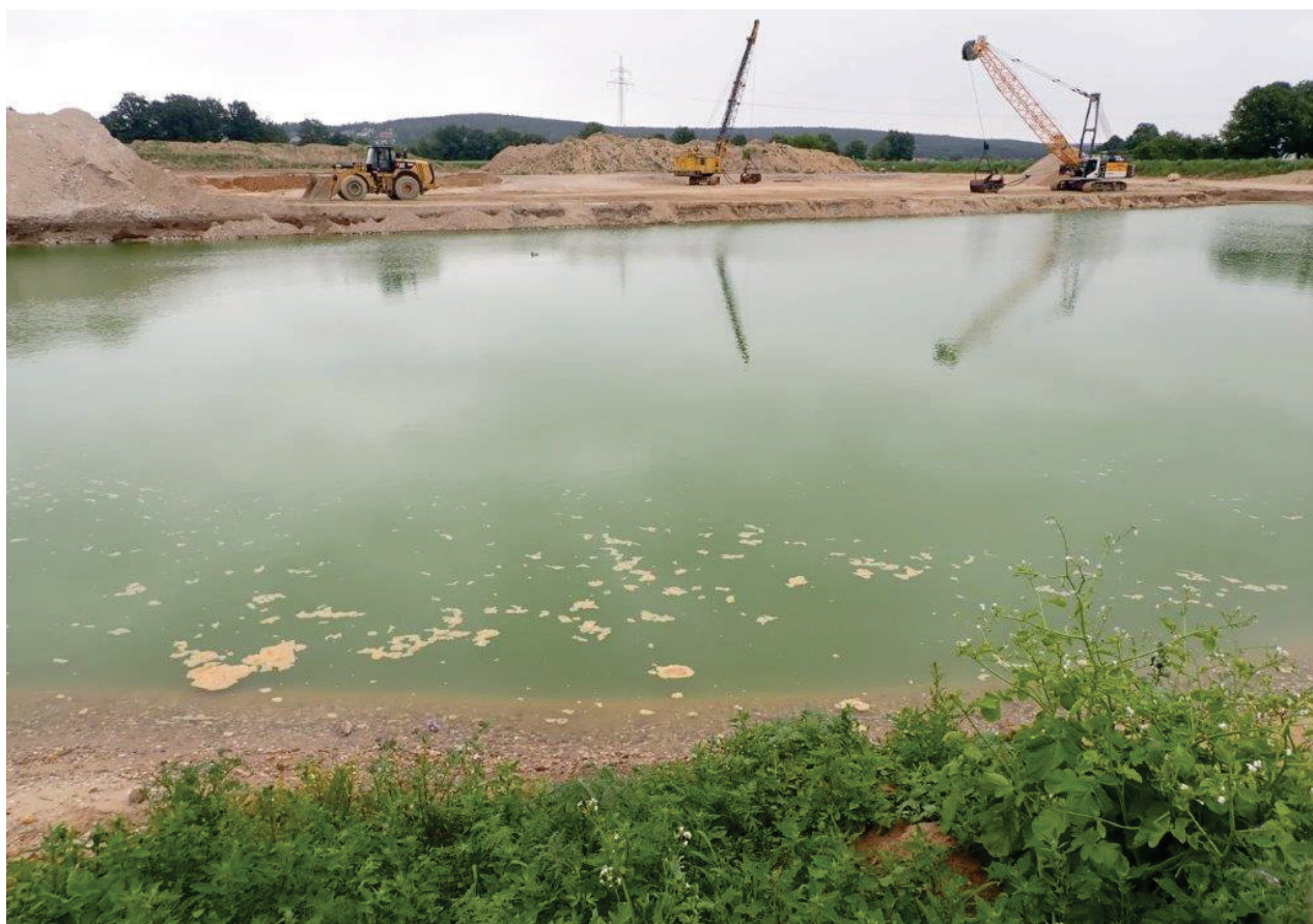
Abbildung 6: Bereits vorhandener Kiesweiher in der Planungsfläche. Wegen des geringen Alters haben sich noch keine Gehölze eingestellt.