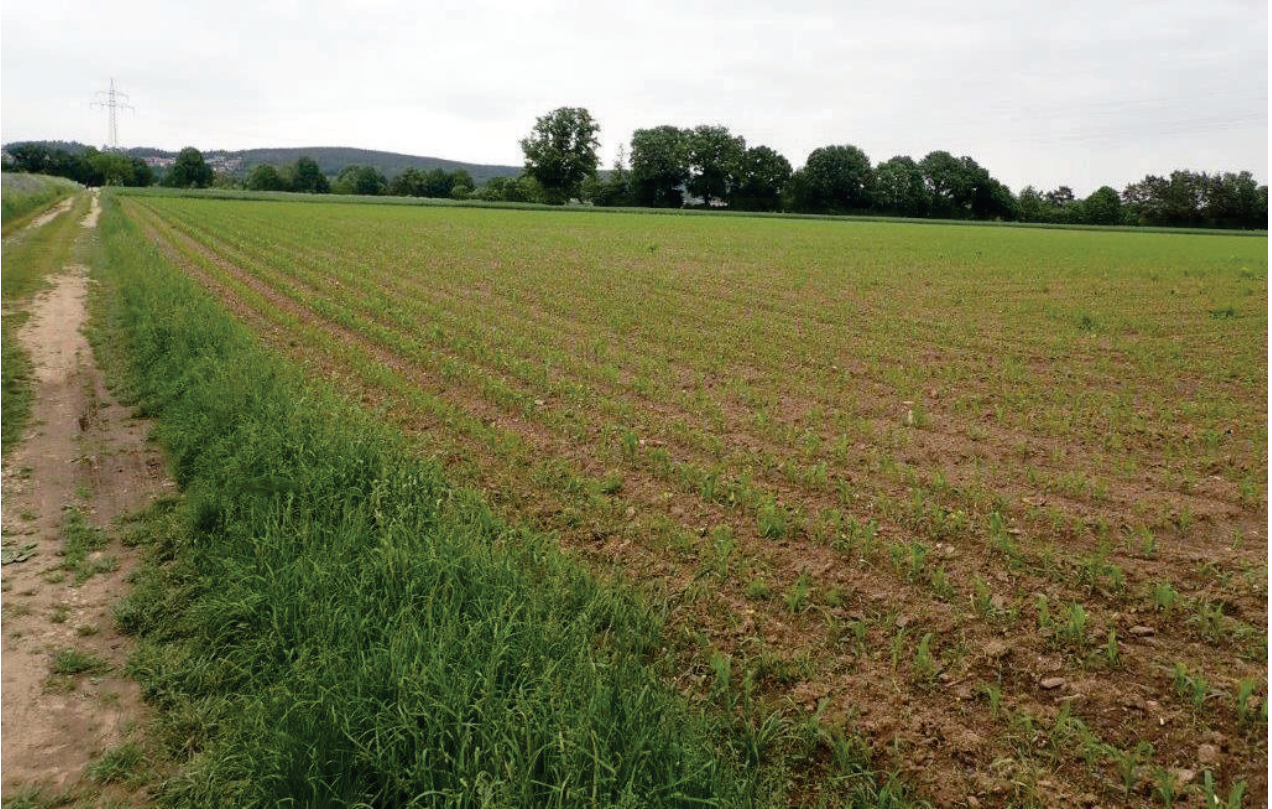
Abbildung 7: Ackerfläche innerhalb der geplanten Erweiterung. Im Hintergrund sind Ufergehölze der Naab zu sehen, die ungefähr die östliche Grenze der Abbauerweiterung darstellen. Man blickt von aktuell südlichen Abbaurand der Erweiterungsfläche nach Osten (Foto: Moos, Mai 2022).