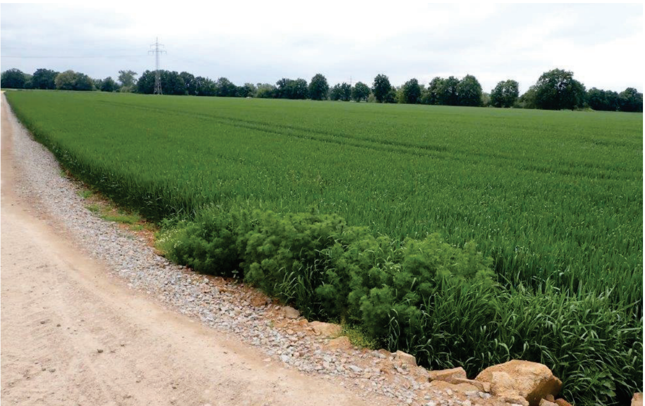
Abbildung 8: Landwirtschaftliche Fläche im Südostteil der geplanten Erweiterung. Im Getreidefeldern brütet die Wiesenschafstelze.