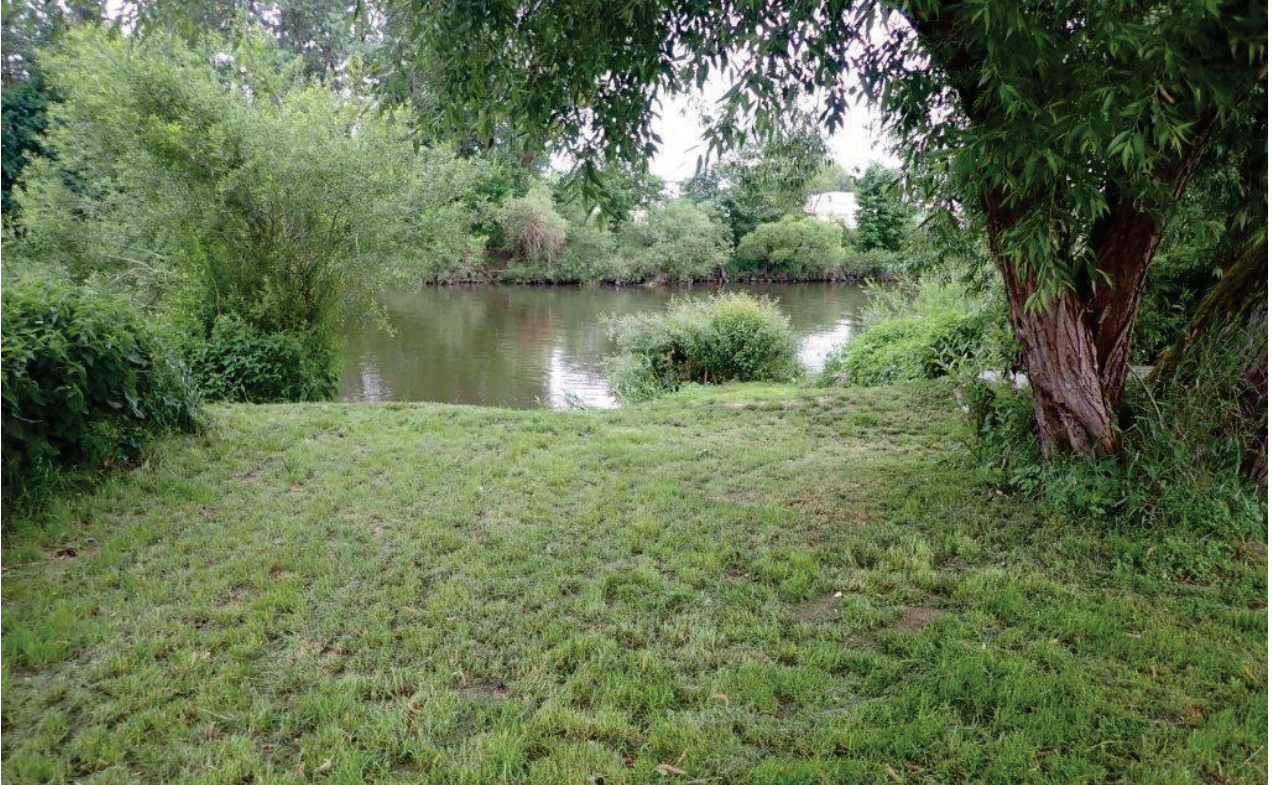
Abbildung 4: Ufer der Naab mit Angelnutzung; der Ufersaum wird regelmäßig gemäht, damit ein Zugang zum Gewässer möglich ist, auch die Zufahrtswege werden gemäht. Dazu gibt es gestaltete Sitzplätze (Foto: Moos, August 2023).