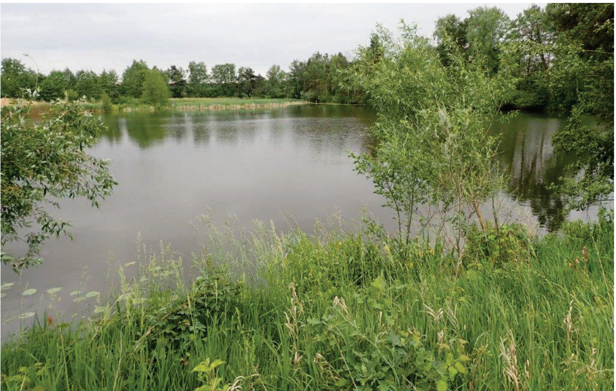
Abbildung 5: Aufgelassener Kiesweiher südlich des Planungsgebiets mit relativ jungem Gehölzsaum (Foto: Moos, Juni 2022).