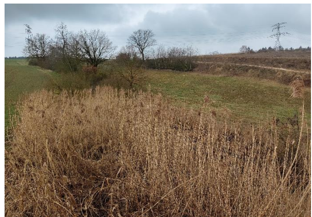
Abb. 2 Foto Schilfbestand, März 2025, Quelle: Landratsamt Landshut, untere Naturschutzbehörde

Die Fläche wird im Zuge des Antrages auf Abgrabungsgenehmigung „Kiesabbau Kläham Erweiterung Südost“ zur Erweiterung des bestehenden Kiesabbaus Kläham überplant und muss dementsprechend entfernt werden. Somit ist der Schilfbestand 1:1 zu ersetzen.