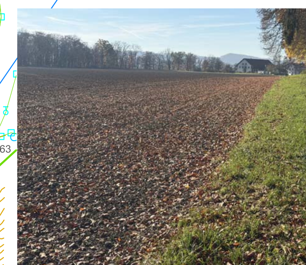
A11 Intensiv ackerbaulich genutzter Bereich mit stark verarmter Segetalvegetation. Rechts im Foto der Grünweg V332 ( 2025)

Erweiterung des Kiesabbaus und Wiederverfüllung mit Material bis Z1.1