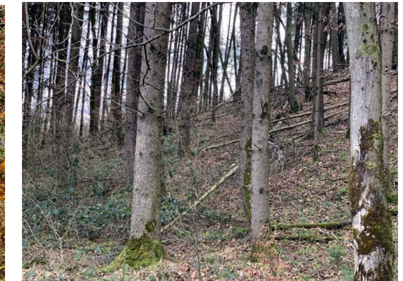
N712 Der noch vorhandene Fichtenbestand ist als strukturärmer Altersklassenwald einzustufen (Ausgangszustand von 2020)