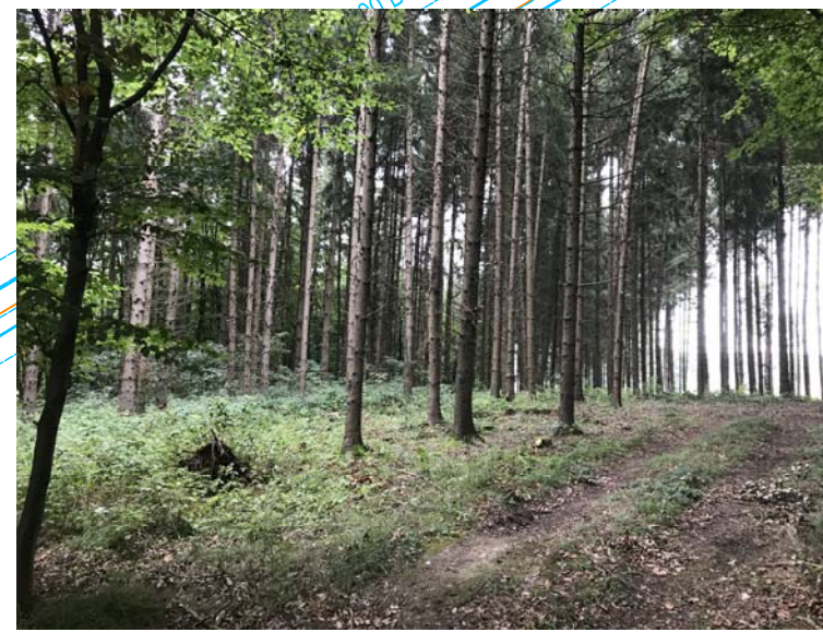
V332 Grünweg; wird für den Schutzwall genutzt; einzelne Bäume (L232) werden umgangen, können jedoch beeinträchtigt werden. Dies wird entsprechend der Bayerischen Kompensationsverordnung (BayKompV) berücksichtigt (Fotos 2022).