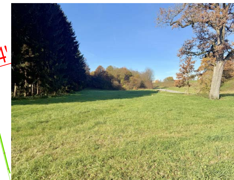
G11 Grünland, genutzt, arten- und strukturarm (Foto 2025)