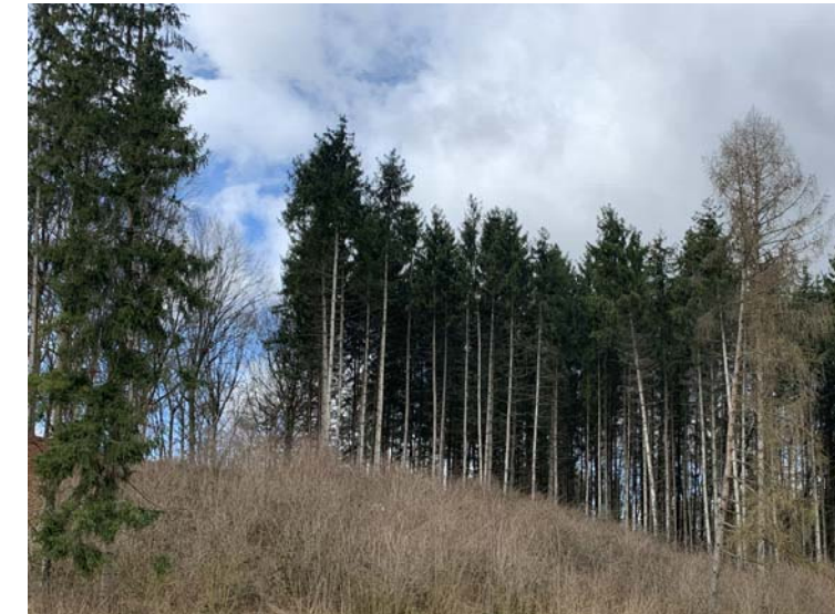
N711 Der Fichtenbestand wurde auf Teilflächen wg. Borkenkäfer und Windwurf entfernt. Bei Aufforstung ist die Fläche als N711 einzustufen. Vorübergehende Hiebflächen sind in der BayKompV nicht bewertet. Links der relevante Ausgangszustand von 2020. Der aktuelle Zustand in 2025, rechts, zeigt, dass die Fichten weiter "ausdünnen".