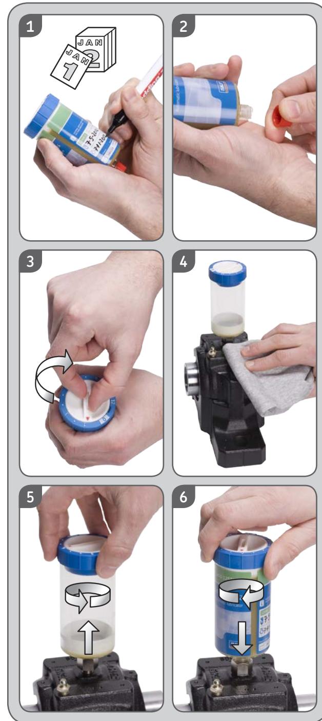
SKF LAGD 60 & LAGD 125