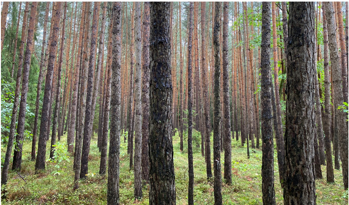
Abb. 2: Kiefernwald im BA2; September 2022

Die folgenden Abbildungen zeigen die beschriebenen Strukturen exemplarisch (vgl. Abb. 2, Abb. 3).