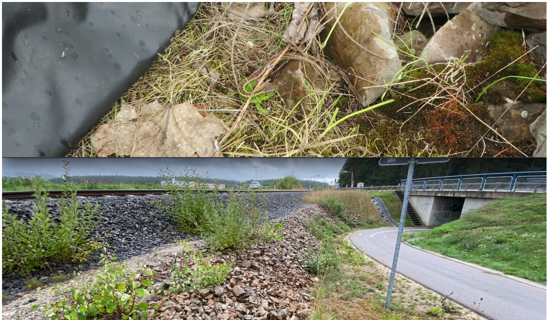
Abb. 4: Männliche Zauneidechse im Untersuchungsgebiet 2017 (oben) und der unveränderte Lebensraum im Jahr 2022 (unten) in BA2

Ebenfalls ist aufgrund der unveränderten Habitatstrukturen weiterhin von Vorkommen der bereits nachgewiesenen Fledermäuse, Amphibien, Reptilien und Vogelarten auszugehen. Dies gilt ebenfalls für die Ortsumfahrung Mühlhausen im Süden des BA3. Die neu angelegten Straßennebenflächen sind weiterhin für die vorkommende Zauneidechse als Lebensraum geeignet.