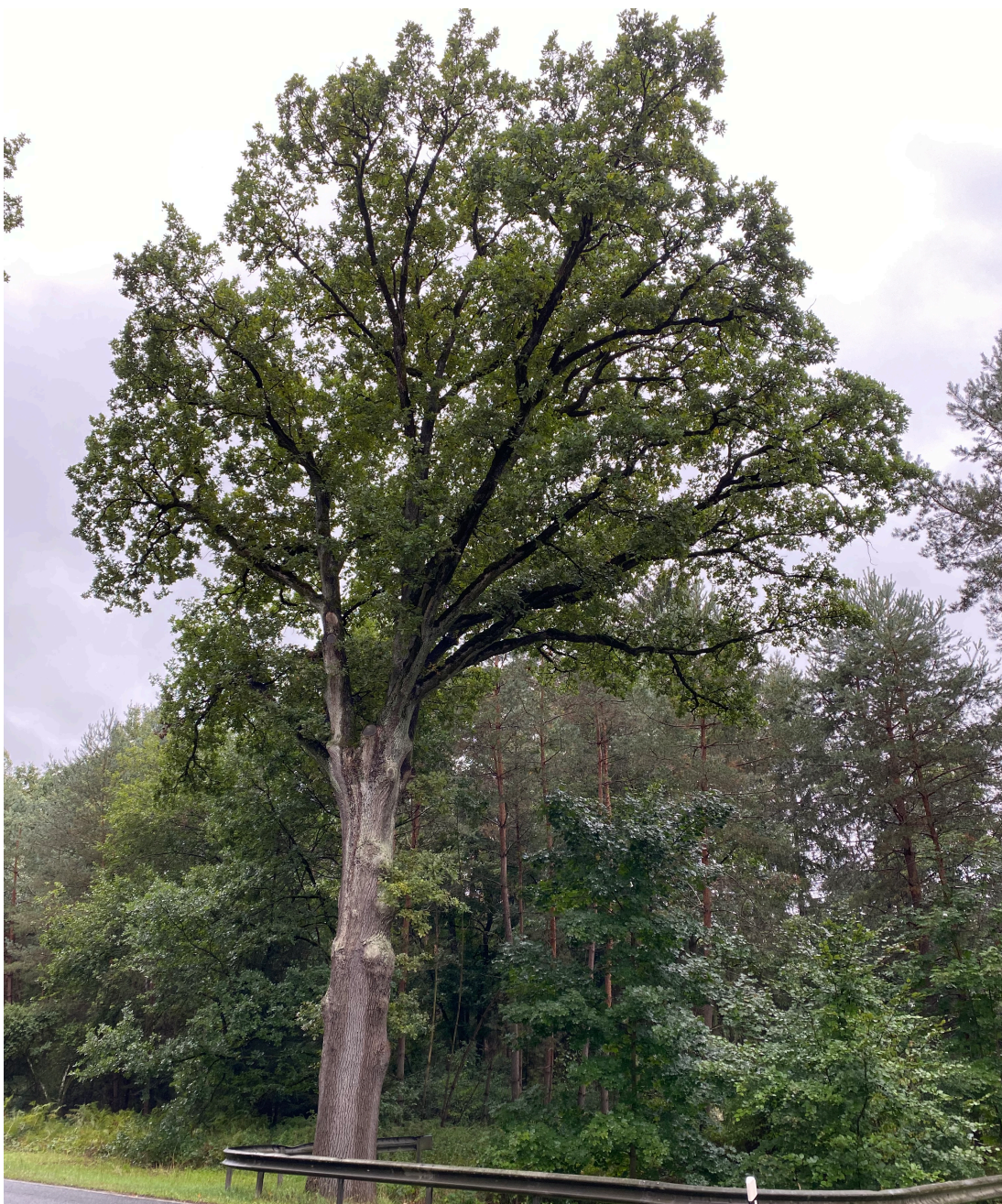
Abb. 3: Straßennahe Eiche im BA3 gegenüber Kanalschleuse; September 2022