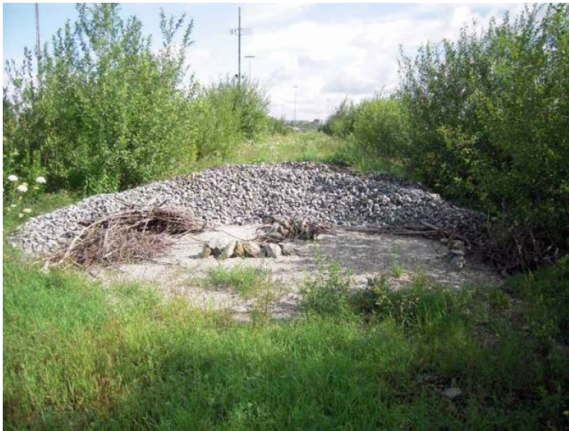
Abbildung 1: Angelegter Steinriegel als Beispiel

Pflege: Die Eidechsenfläche ist vor Gehölsukzession zu bewahren, es wird eine jährliche herbstliche Mahd in diesem Bereich vorgesehen. Der Gehölzanteil darf 20 % nicht übersteigen, ggf. ist auszustocken.