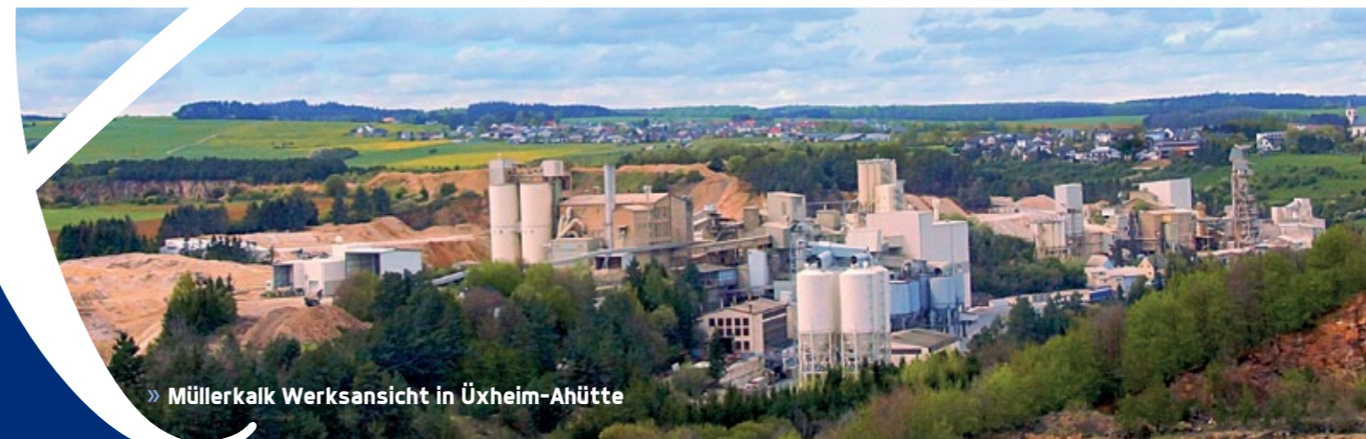
» Müllerkalk Werksansicht in Üxheim-Ahütte