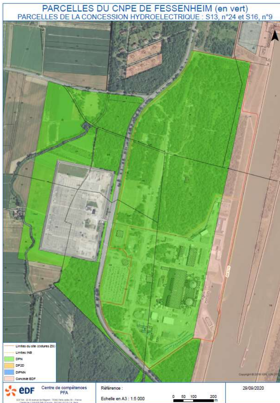
Figure 2.b - Propriété des parcelles sous l'emprise de l'INB n°75.

Pour le terrain servant d'emprise à l'INB n°75, la parcelle n° 9 de la section 16 de la commune de Fessenheim est située sur le domaine public de l'Etat et affectée à l'hydroélectricité et à la navigation.