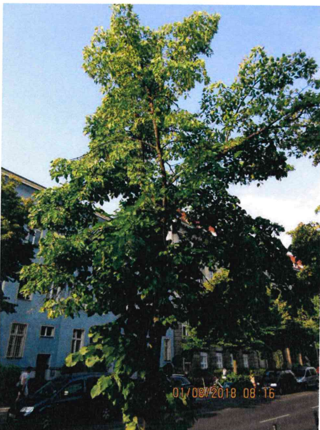
Abb.:4. lückige durchsichtige Krone der Linde

Es erfolgt ein Wertminderungsabzug von 35%.