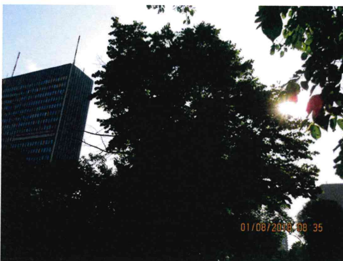
Abb.:10. Krone ungepflegt und nicht geschlossen, einiges an Totholz

Die Linde Nr. 103 wies keine Auffälligkeiten an Wurzeln oder Stamm auf. Die Krone war ungepflegt und nicht ganz geschlossen mit einigem Totholz. Es erfolgt ein Wertminderungsabzug von 15%.