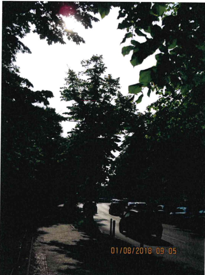
Abb.:12. Von Versiegelung betroffene Flächen am geplanten Ausgang Ost: die Baumscheibe und ein 2m breiter Streifen links des Gehwegs.