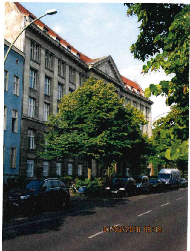
Abb.:5. Zum Vergleich: „normale“ Kronenform, fast geschlossen und Blickdicht