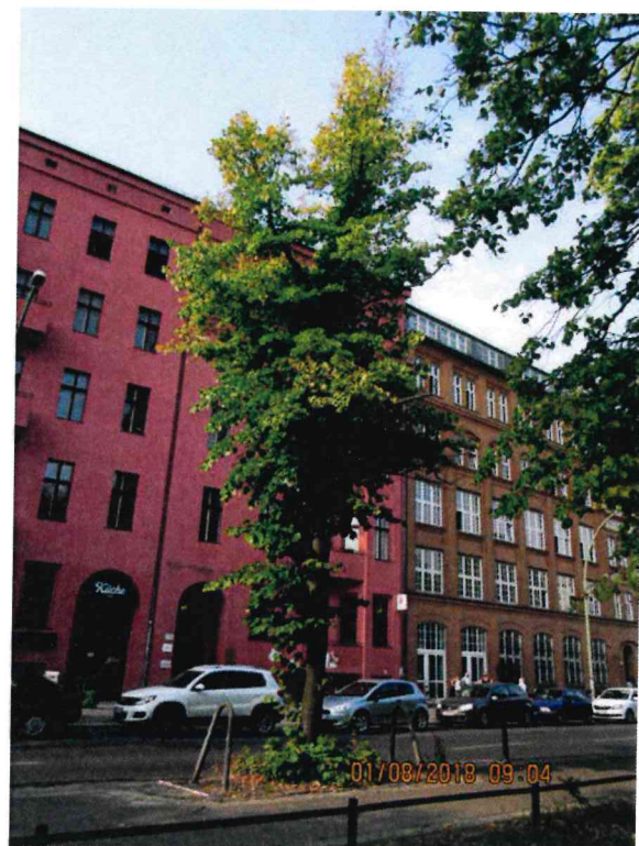
Abb.:8. Linde Nr. 130 mit um mehr als 50% reduzierter Krone