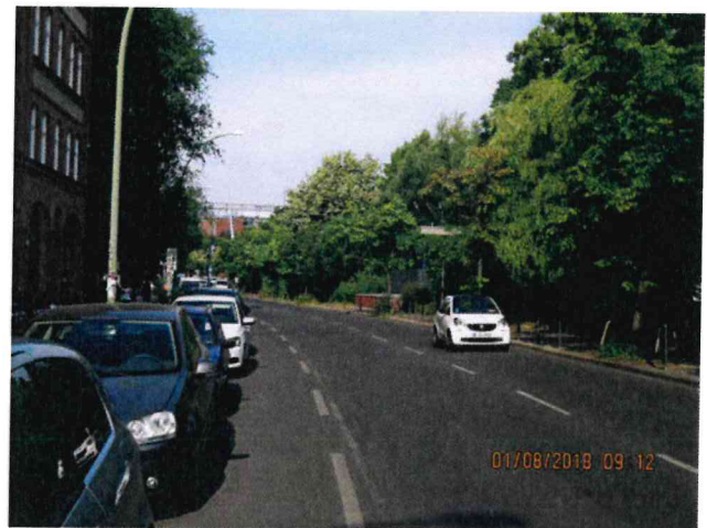
Abb.:1. Tempelhofer Ufer Richtung Osten und Richtung Westen