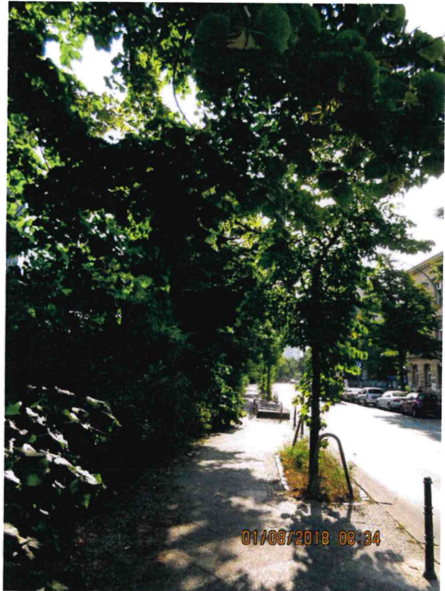
Abb.:11. Blicke auf die von Versiegelung betroffenen Flächen: Baumscheibe und Streifen parallel zum Gehweg