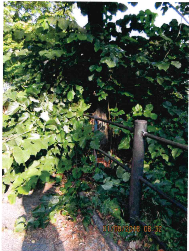
Abb.:9. Linde Nr. 103, Standort in Grünfläche, direkt hinter dem Geländer

Die Linde Nr. 103 wies keine Auffälligkeiten an Wurzeln oder Stamm auf. Die Krone war ungepflegt und nicht ganz geschlossen mit einigem Totholz. Es erfolgt ein Wertminderungsabzug von 15%.