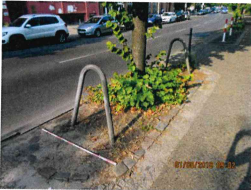
Abb.:7. Standort der Linde Nr. 130, üblich bei Straßenbäumen

Auch die Linde Nr. 130 hat ihre Krone nicht arttypisch ausgebildet. Der Verzweigungsaufbau ist unzureichend gestaffelt. Wenige Grobäste sorgen für eine Art Belaubung des Stammes, dadurch ergibt sich nicht das Bild des für einen Straßenbaum erwünschten Hochstammes der sich in einen Stamm mit Krone gliedert.