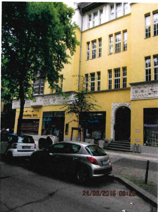
Abb.:3. 18/20er Stammumfang: Nachpflanzung einer Linde am Rüdeshheimer Platz Dieser Baum erfüllt seine Funktion noch nicht. Er ist auf den ersten Blick kaum zu sehen.

Damit ein Baum der Ausgangsgröße 18/20cm Stammumfang diese Größe erreicht, sind bei Linden als mittelstark bis stark wachsende Gehölzart 20 Jahre Herstellungszeit anzusetzen. Dann kann eine Linde eine Höhe von 10m bis 12m und vor allem eine Kronenbreite von 5-6m erreicht haben, womit sich die gestalterische Funktion für das Straßengrundstück erfüllt.