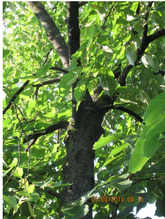
Abb.:6. Linde Nr. 102 weist keinen durchgehenden Leittrieb auf