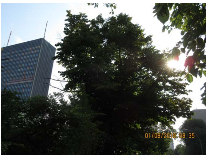
Abb.:10. Krone ungepflegt und nicht geschlossen, einiges an Totholz

Die Linde Nr. 103 wies keine Auffälligkeiten an Wurzeln oder Stamm auf. Die Krone war ungepflegt und nicht ganz geschlossen mit einigem Totholz. Es erfolgt ein Wertminderungsabzug von 15%.