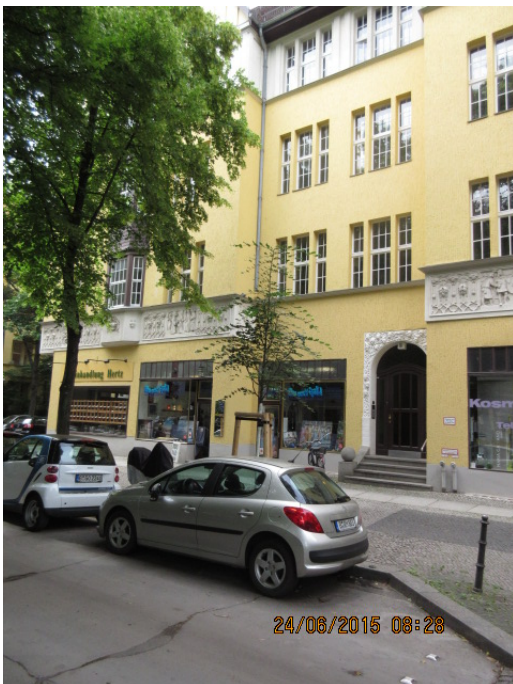
Abb.:3. 18/20er Stammumfang: Nachpflanzung einer Linde am Rüdeshimer Platz Dieser Baum erfüllt seine Funktion noch nicht. Er ist auf den ersten Blick kaum zu sehen.

Damit ein Baum der Ausgangsgröße 18/20cm Stammumfang diese Größe erreicht, sind bei Linden als mittelstark bis stark wachsende Gehölzart 20 Jahre Herstellungszeit anzusetzen. Dann kann eine Linde eine Höhe von 10m bis 12m und vor allem eine Kronenbreite von 5-6m erreicht haben, womit sich die gestalterische Funktion für das Straßengrundstück erfüllt.