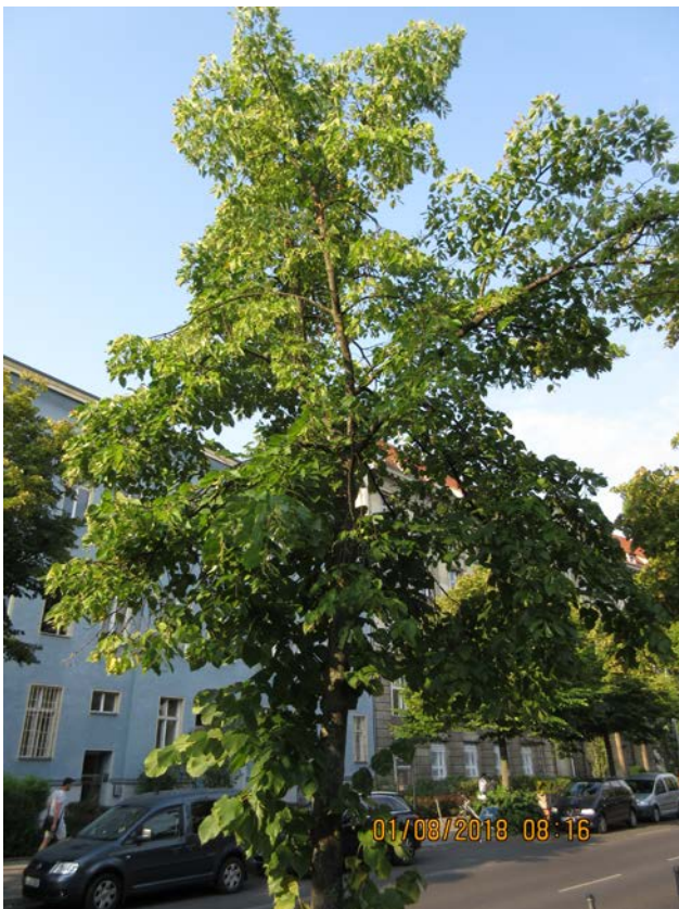
Abb.:4. lückige durchsichtige Krone der Linde

Es erfolgt ein Wertminderungsabzug von 35%.