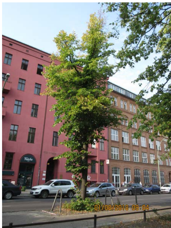
Abb.:8. Linde Nr. 130 mit um mehr als 50% reduzierter Krone