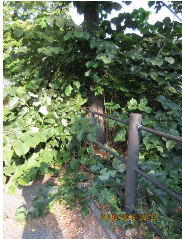
Abb.:9. Linde Nr. 103, Standort in Grünfläche, direkt hinter dem Geländer

Die Linde Nr. 103 wies keine Auffälligkeiten an Wurzeln oder Stamm auf. Die Krone war ungepflegt und nicht ganz geschlossen mit einigem Totholz. Es erfolgt ein Wertminderungsabzug von 15%.