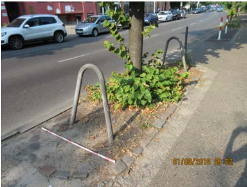
Abb.:7. Standort der Linde Nr. 130, üblich bei Straßenbäumen

Auch die Linde Nr. 130 hat ihre Krone nicht arttypisch ausgebildet. Der Verzweigungsaufbau ist unzureichend gestaffelt. Wenige Grobäste sorgen für eine Art Belaubung des Stammes, dadurch ergibt sich nicht das Bild des für einen Straßenbaum erwünschten Hochstammes der sich in einen Stamm mit Krone gliedert.