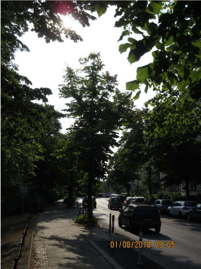
Abb.:12. Von Versiegelung betroffene Flächen am geplanten Ausgang Ost: die Baumscheibe und ein 2m breiter Streifen links des Gehwegs.