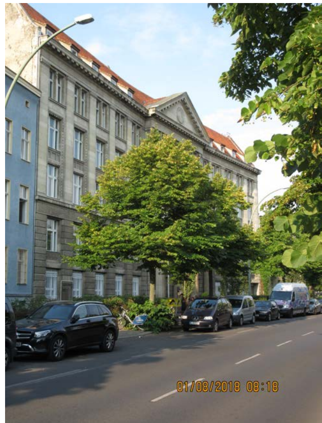
Abb.:5. Zum Vergleich: „normale“ Kronenform, fast geschlossen und Blickdicht