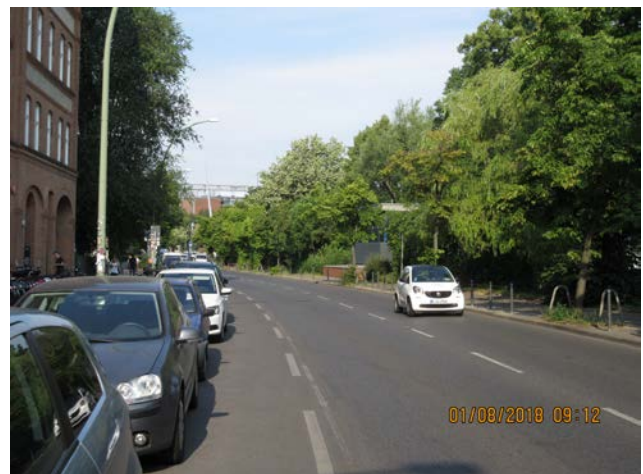
Abb.:1. Tempelhofer Ufer Richtung Osten und Richtung Westen