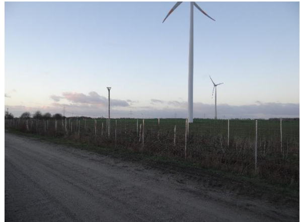
Abbildung 6.17: Blick von FP 2 in Richtung NW