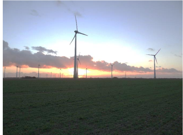
Abbildung 6.15: Blick von FP 2 in Richtung SW