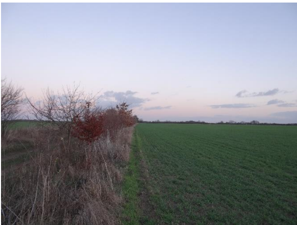
Abbildung 6.4: Blick von FP 1 in Richtung O