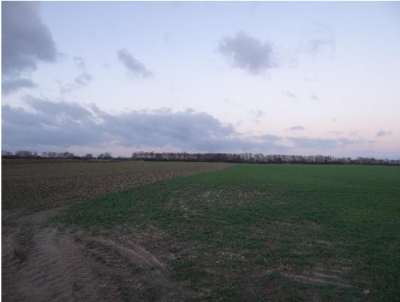
Abbildung 6.2: Blick von FP 1 in Richtung N