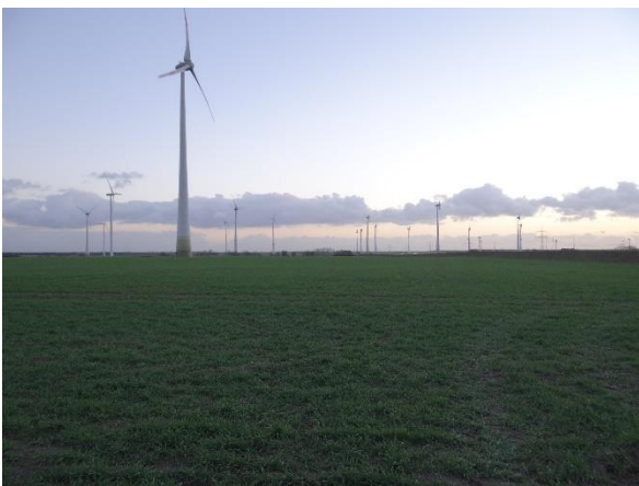
Abbildung 6.6: Blick von FP 1 in Richtung S