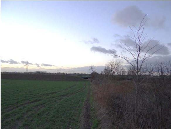
Abbildung 6.8: Blick von FP 1 in Richtung W