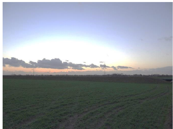
Abbildung 6.7: Blick von FP 1 in Richtung SW