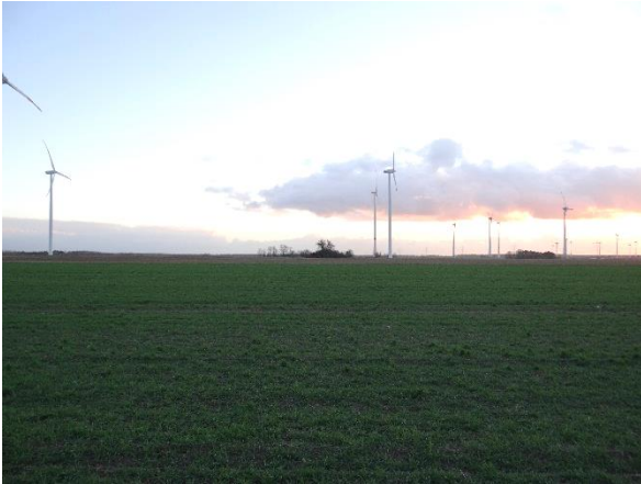
Abbildung 6.14: Blick von FP 2 in Richtung S