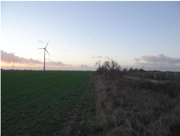
Abbildung 6.16: Blick von FP 2 in Richtung W