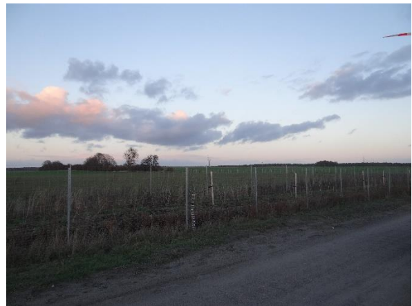
Abbildung 6.11: Blick von FP 2 in Richtung NO