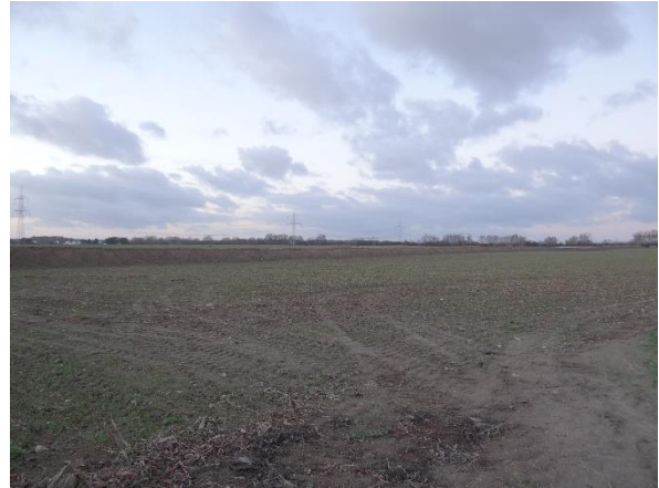
Abbildung 6.9: Blick von FP 1 in Richtung NW