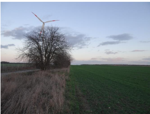
Abbildung 6.12: Blick von FP 2 in Richtung O