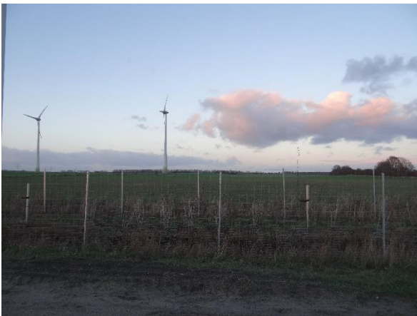
Abbildung 6.10: Blick von FP 2 in Richtung N