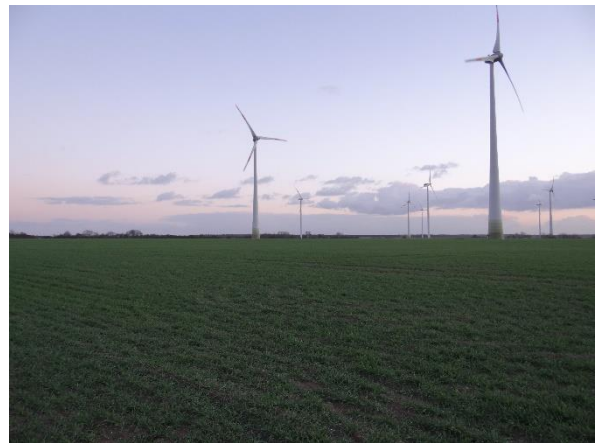
Abbildung 6.5: Blick von FP 1 in Richtung SO