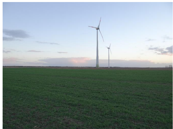
Abbildung 6.13: Blick von FP 2 in Richtung SO