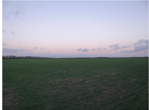
Abbildung 6.3: Blick von FP 1 in Richtung NO