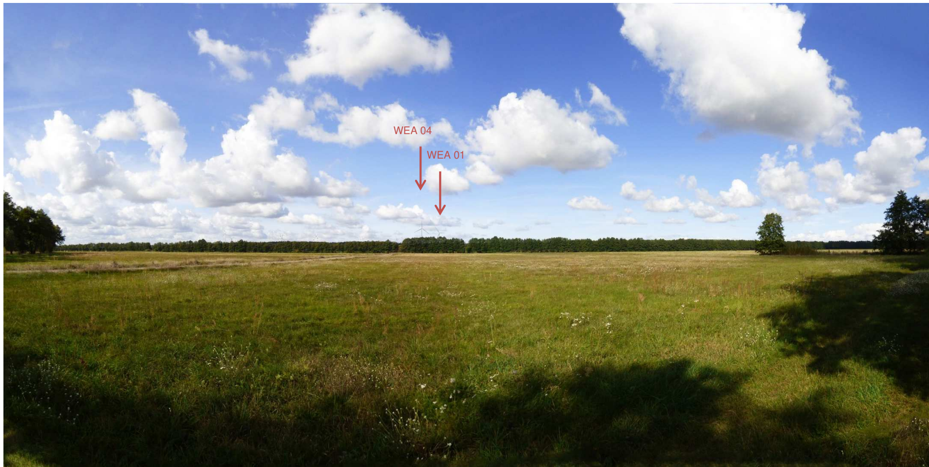
Abbildung 5: Visualisierung Windpark „Werder-Zinndorf“; Fotopunkt 04 – nördlich Hoppegarden