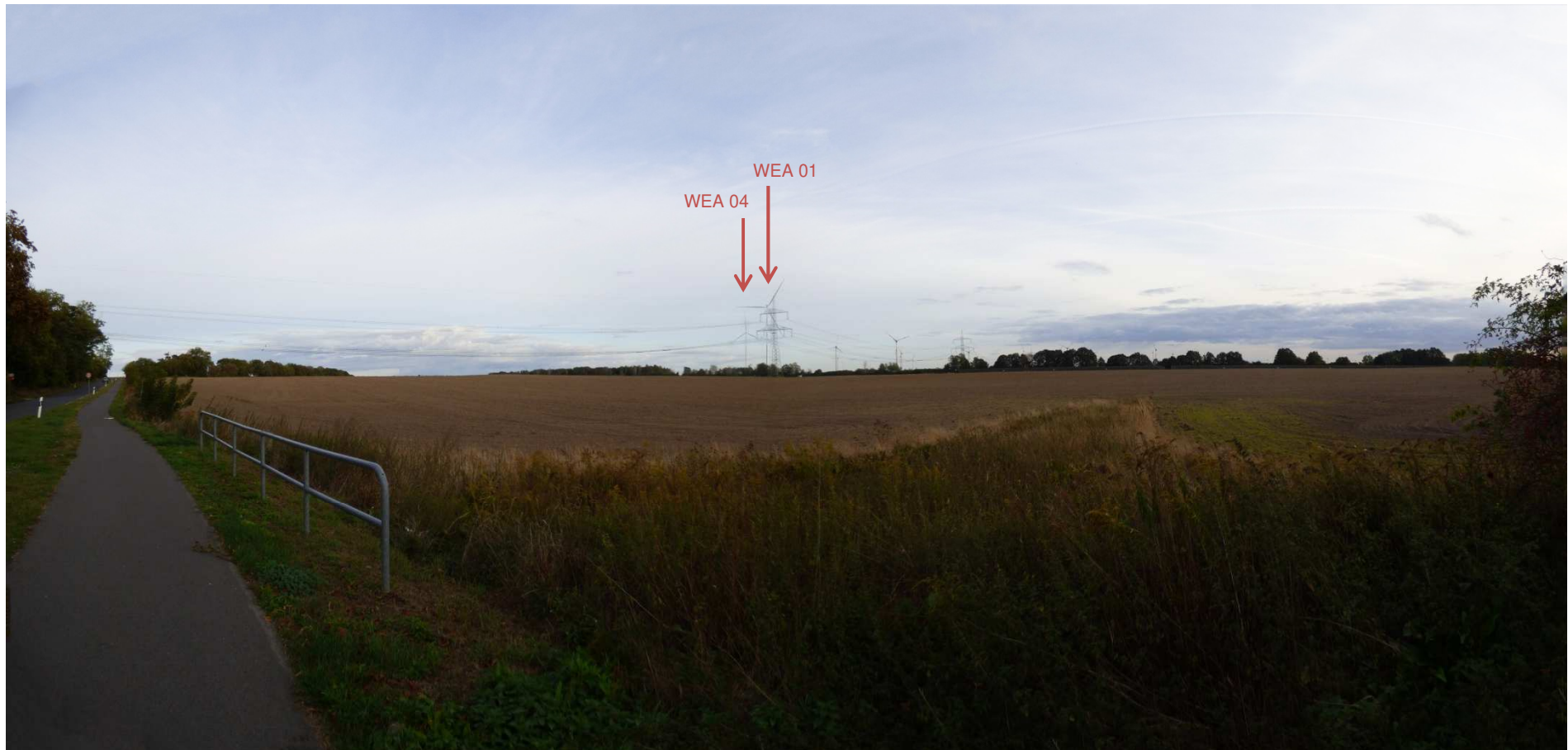
Abbildung 9: Visualisierung Windpark „Werder-Zinndorf“; Fotopunkt 08 – östlich Garzau