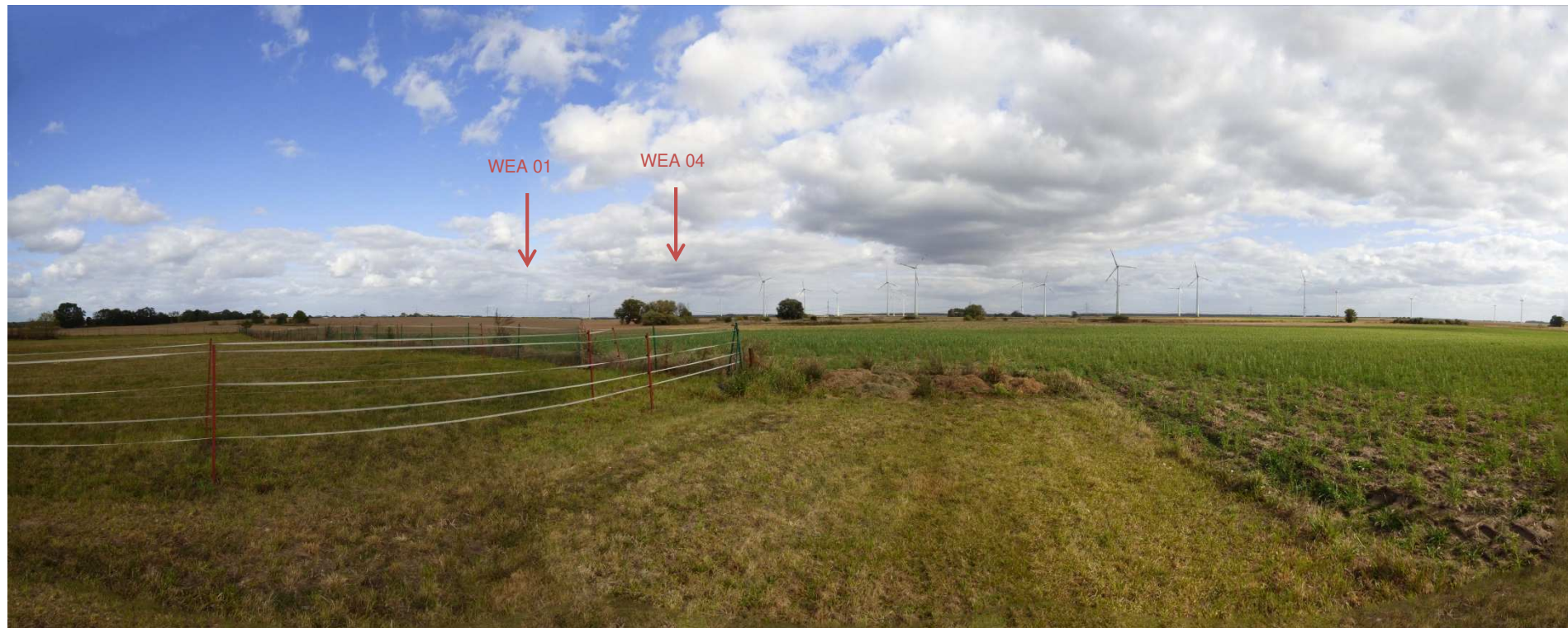
Abbildung 7: Visualisierung Windpark „Werder-Zinndorf“; Fotopunkt 06 – östlich Zinndorf