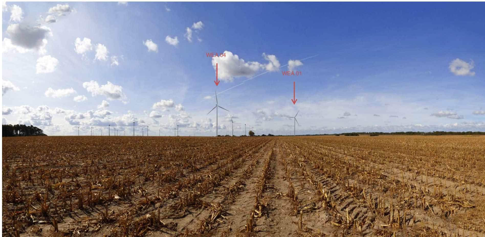
Abbildung 4: Visualisierung Windpark „Werder-Zinndorf“; Fotopunkt 03 – nördlich Sophienfelde