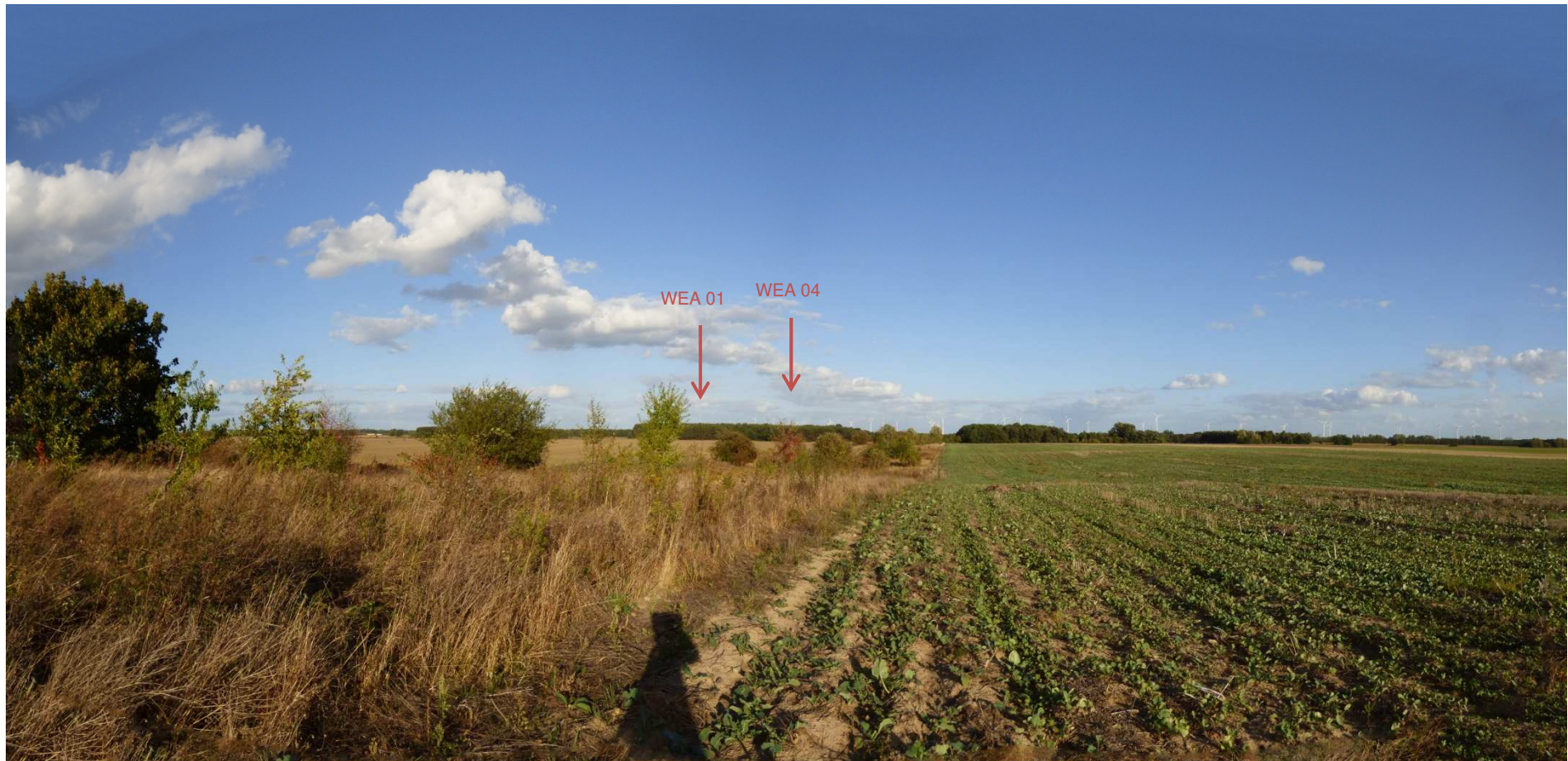
Abbildung 8: Visualisierung Windpark „Werder-Zinndorf“; Fotopunkt 07 – östlich Rehfelde-Dorf