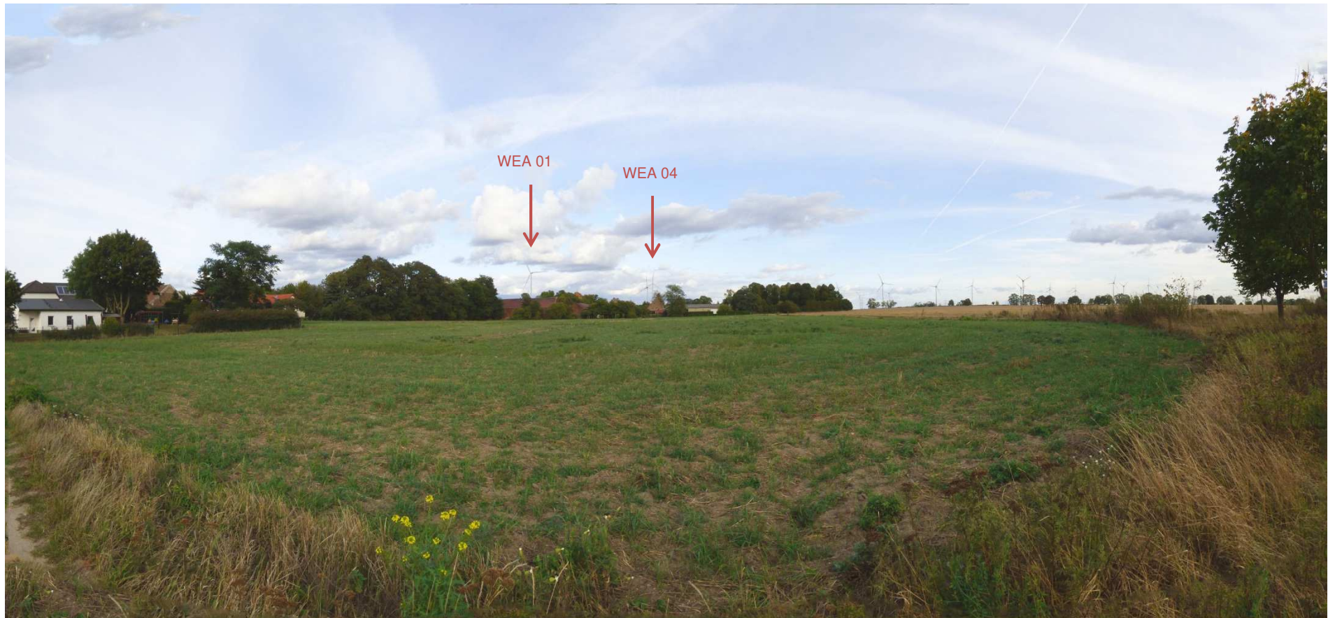
Abbildung 2: Visualisierung Windpark „Werder-Zinndorf“; Fotopunkt 10 – Kirche Altwerder