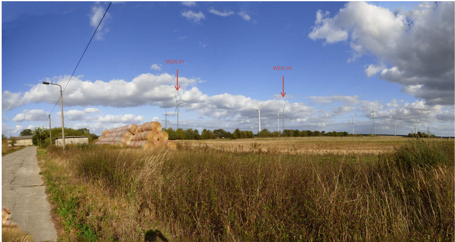
Abbildung 10: Visualisierung Windpark „Werder-Zinndorf“; Fotopunkt 09 – östlich Altwerder