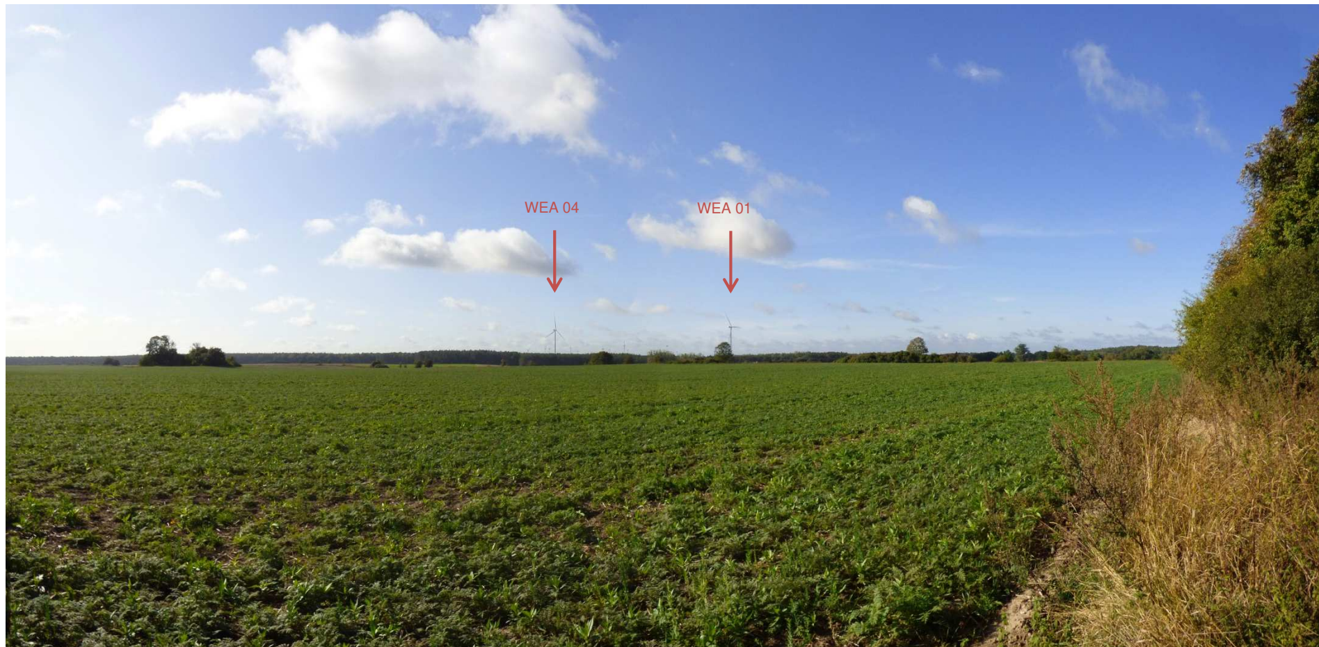
Abbildung 3: Visualisierung Windpark „Werder-Zinndorf“; Fotopunkt 02 – südlich Garzin