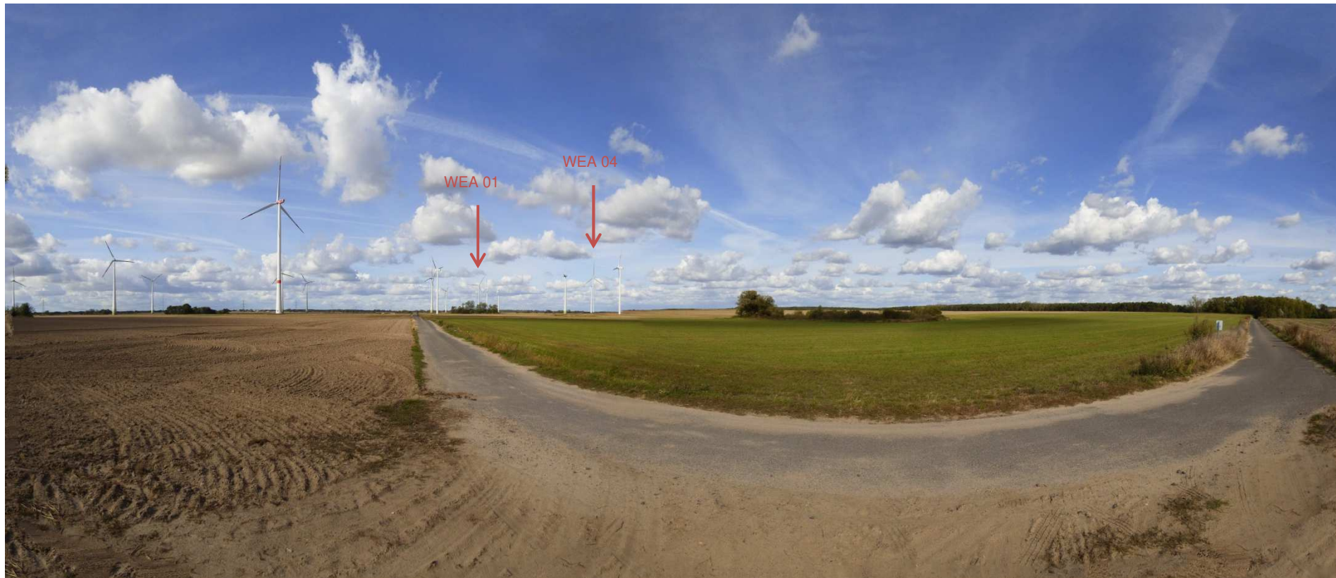
Abbildung 6: Visualisierung Windpark „Werder-Zinndorf“; Fotopunkt 05 – im Bestandwindpark / südlich der geplanten Windenergieanlagen