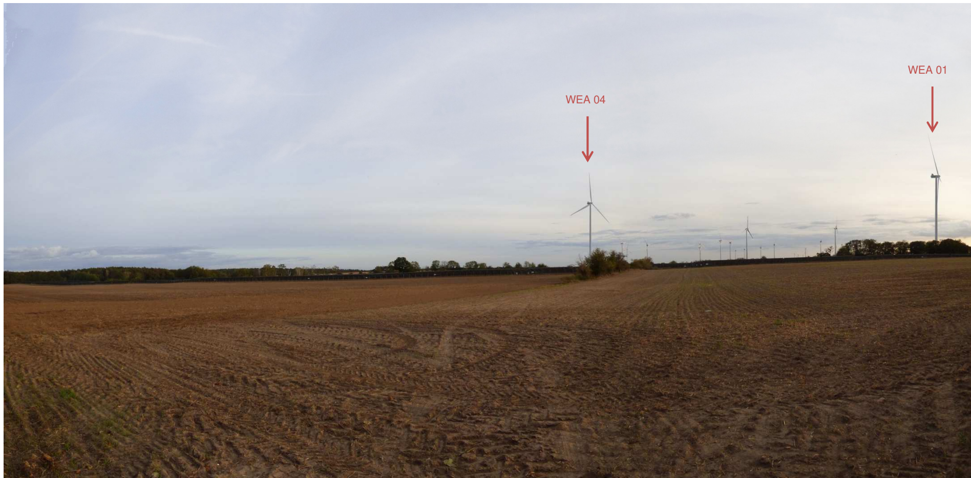
Abbildung 2: Visualisierung Windpark „Werder-Zinndorf“; Fotopunkt 01 – südlich Anitz