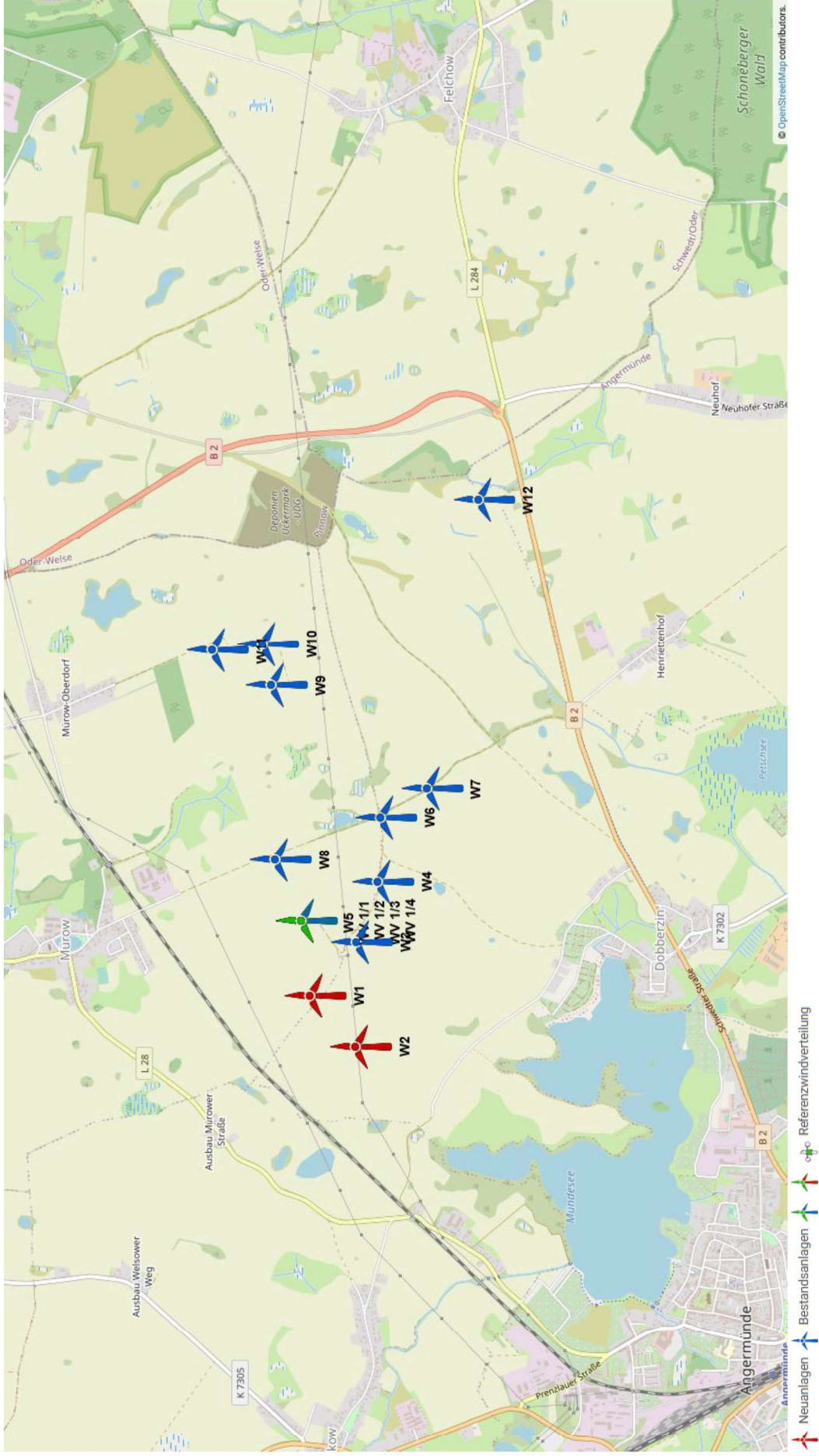
Abbildung 2.1: Zu untersuchende Windparkkonfiguration; Kartenmaterial: [19.1, 19.2]